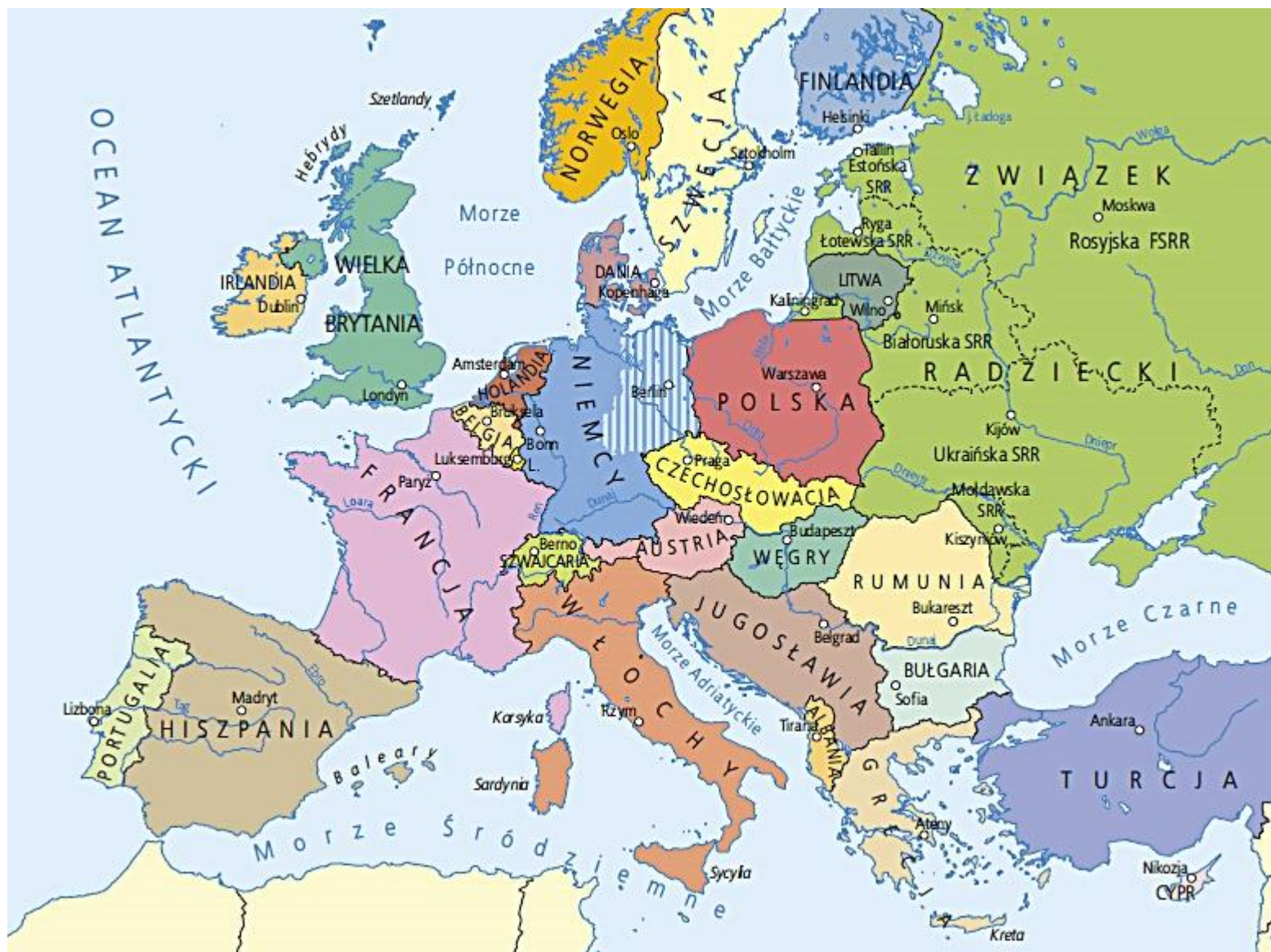
Europa w latach osiemdziesiątych XX wieku