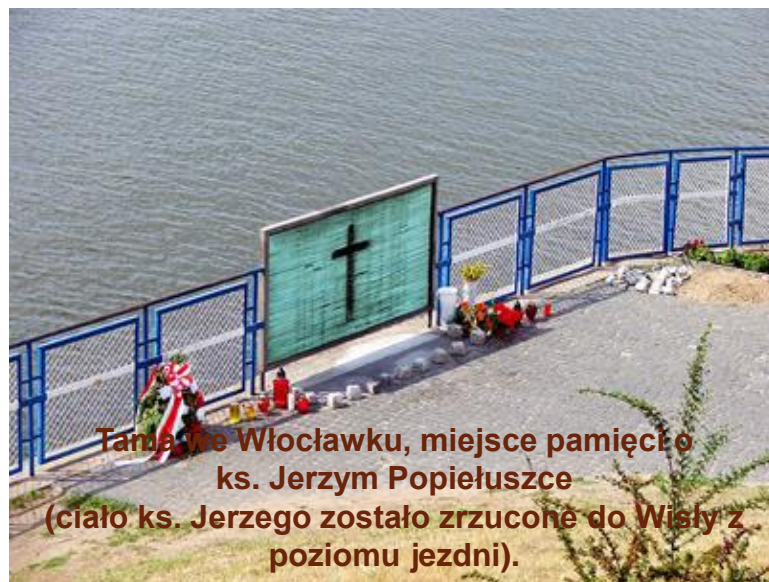
Tamby k. Włocławku, miejsce pamięci o ks. Jerzym Popiełuszce (ciało ks. Jerzego zostało zrzucone do Wisły z poziomu jezdni).