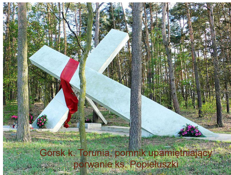
Górsk k. Torunia, pomnik upamiętniający porwanie ks. Popiełuszki