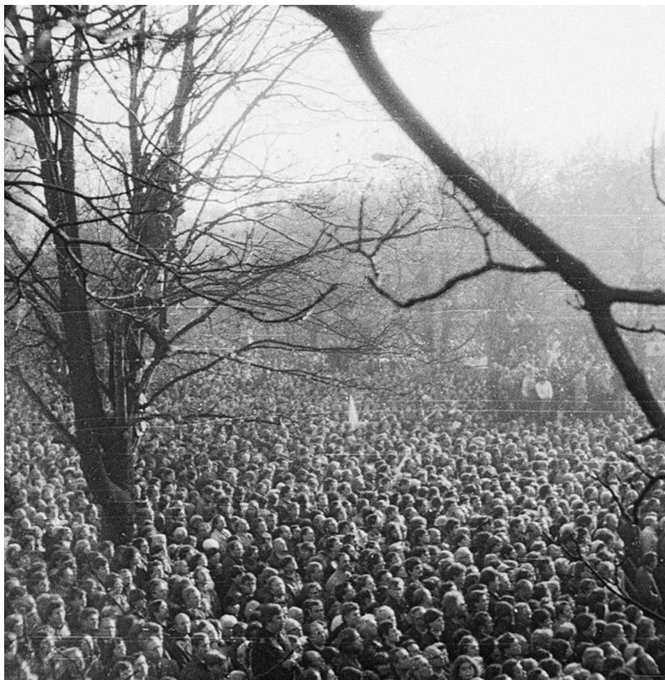
Pogrzeb 3 listopada 1984 r.