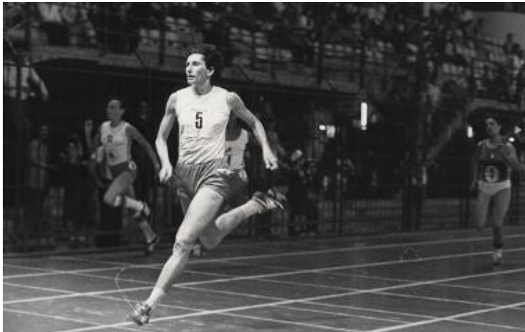
Mistrzostwo olimpijskie Ireny Szewińskiej z 1976 w Montrealu. Polka wygrała na 400 metrów.