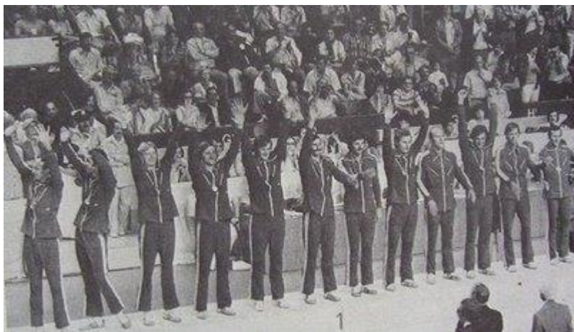
Złoty medal siatkarzy - Mistrzostwa Świata w Meksyku 1974

Jacek Wszola, skoczek w wżwyż. W 1976 roku w Montrealu zdobył złoty medal, cztery lata później w Moskwie srebrny.