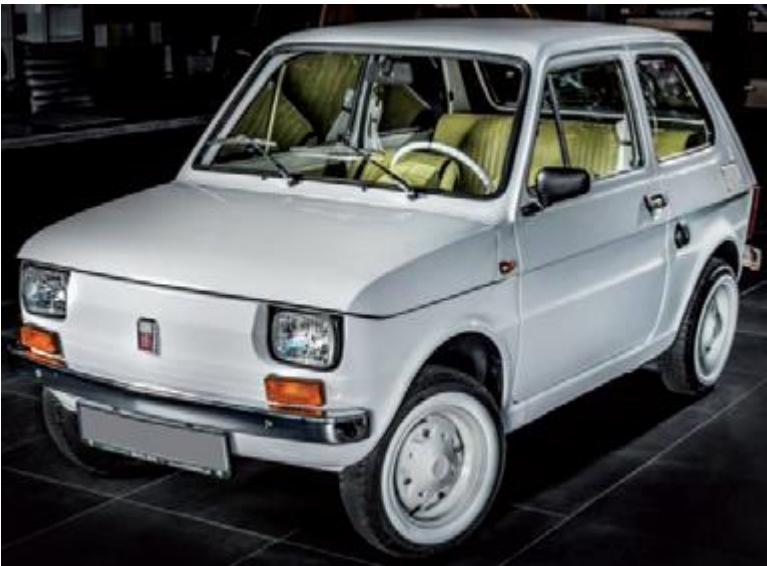
FIAT 126p – samochód produkowany w Bielsku-Białej od 6 VI 1973 r. – symbol „sukcesu gospodarczego” PRL za rządów Edwarda Gierka