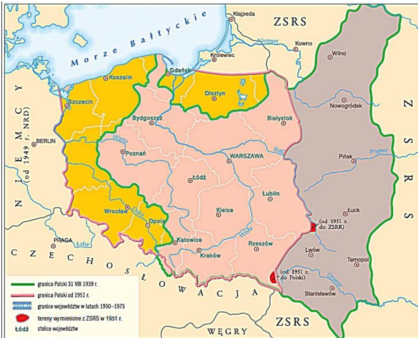
Nowe granice Polski po zakończeniu II wojny światowej