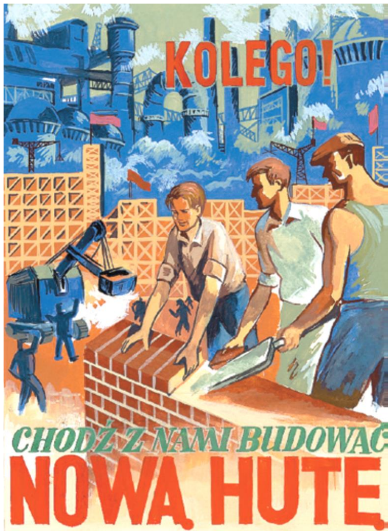
Plakat zachęcający do przyjazdu na budowę Nowej Huty.