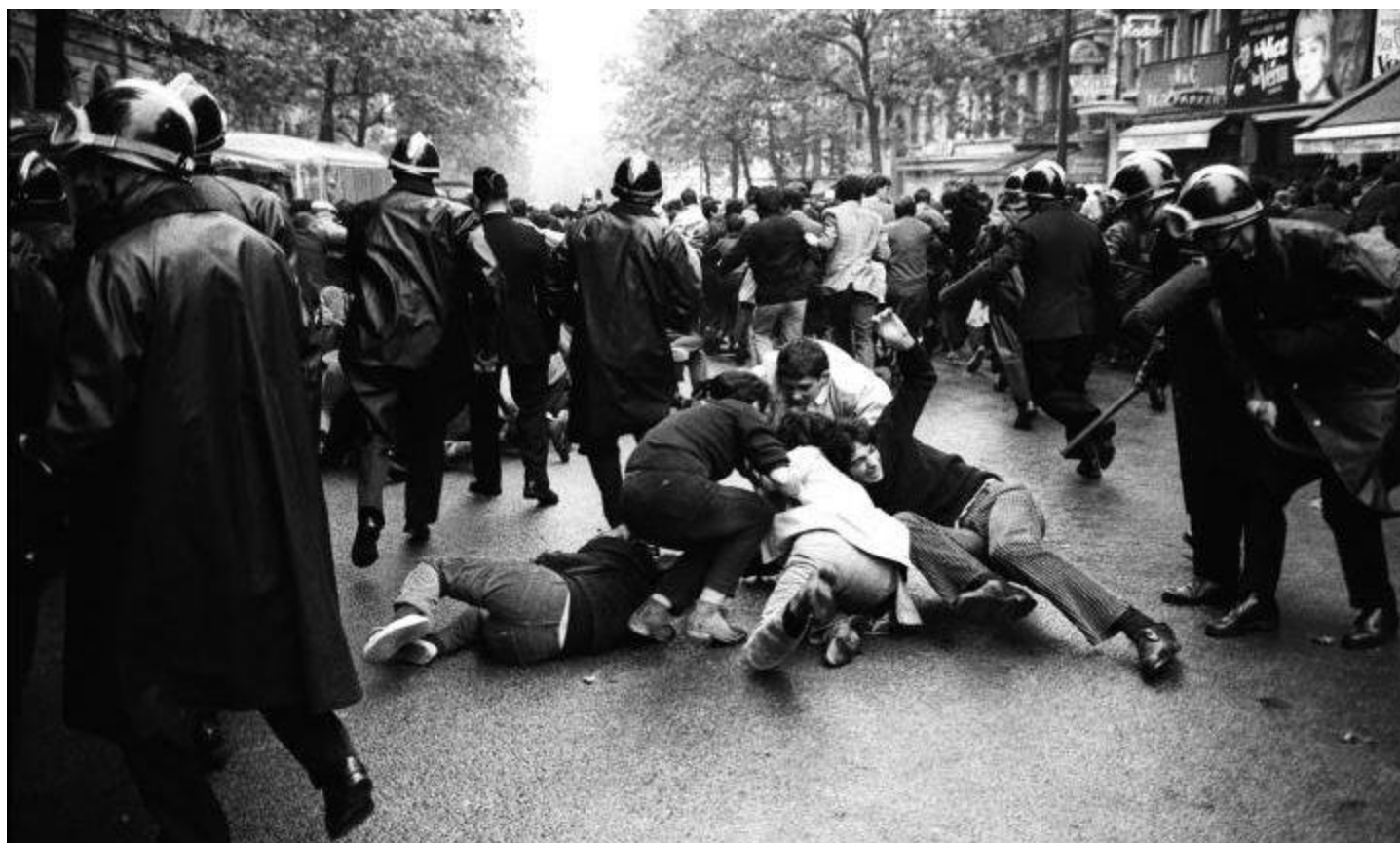
Maj '68 we Francji