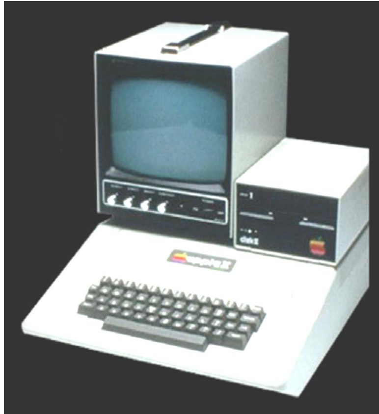
Apple II – jeden z pierwszych komputerów osobistych