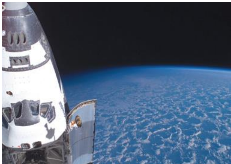
Ziemia widziana z pokładu wahadłowca