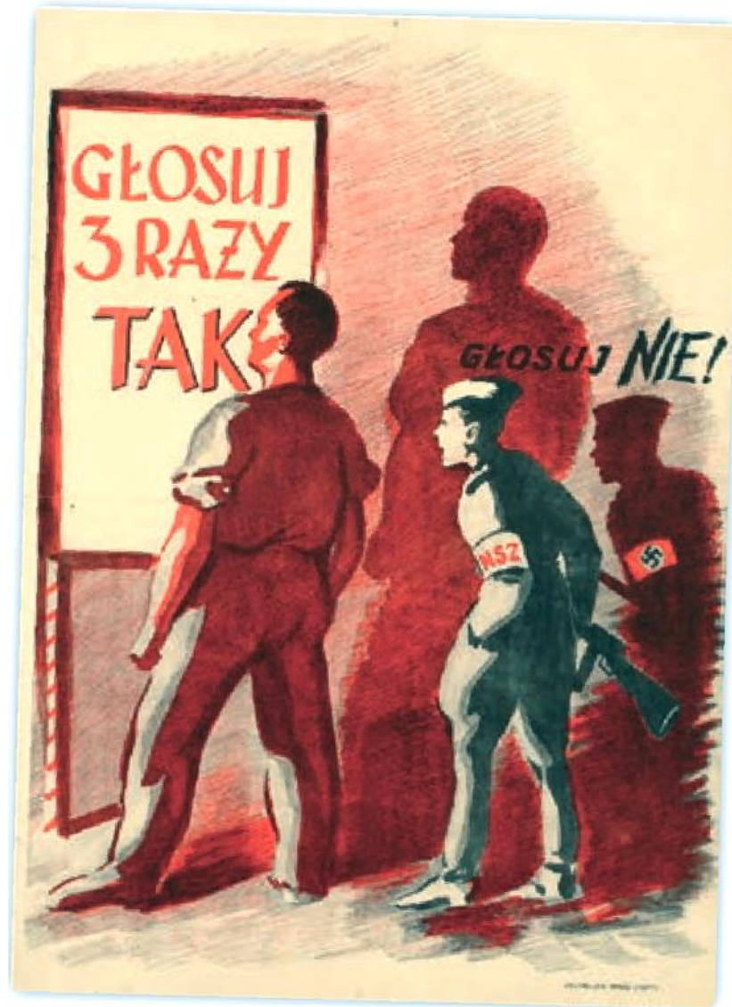
Plakat propagandowy z 1946 r. Do głosowania „nie” namawia żołnierz antykomunistycznych Narodowych Sił Zbrojnych, ukazany jako przebrany hitlerowiec.