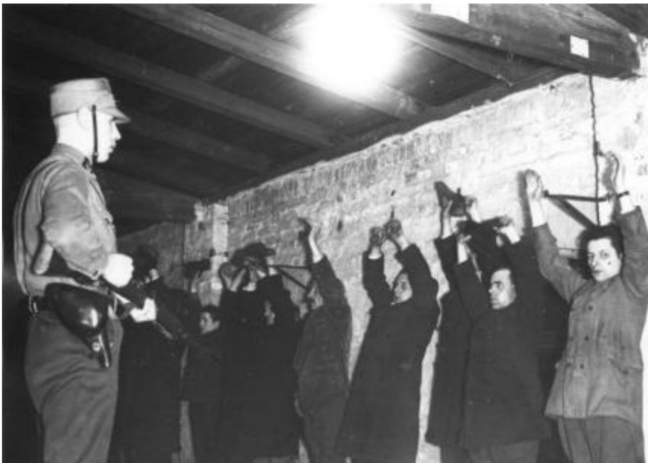
(6. März 1933)

SS z rozkazu Adolfa Hitlera morduje przywódców SA