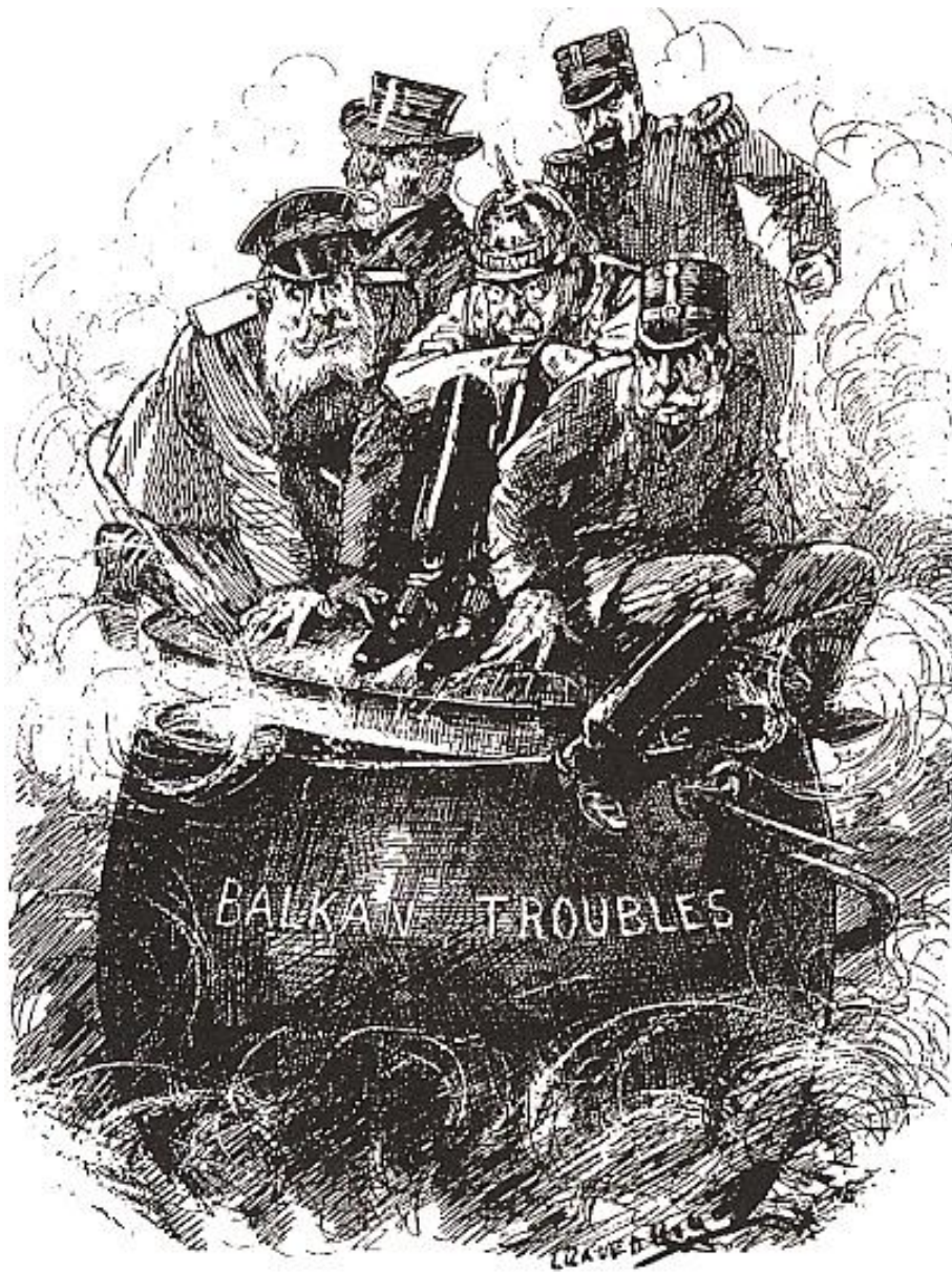
The Boiling Point

Karykatura przedstawiająca „Bałkański Kocioł”