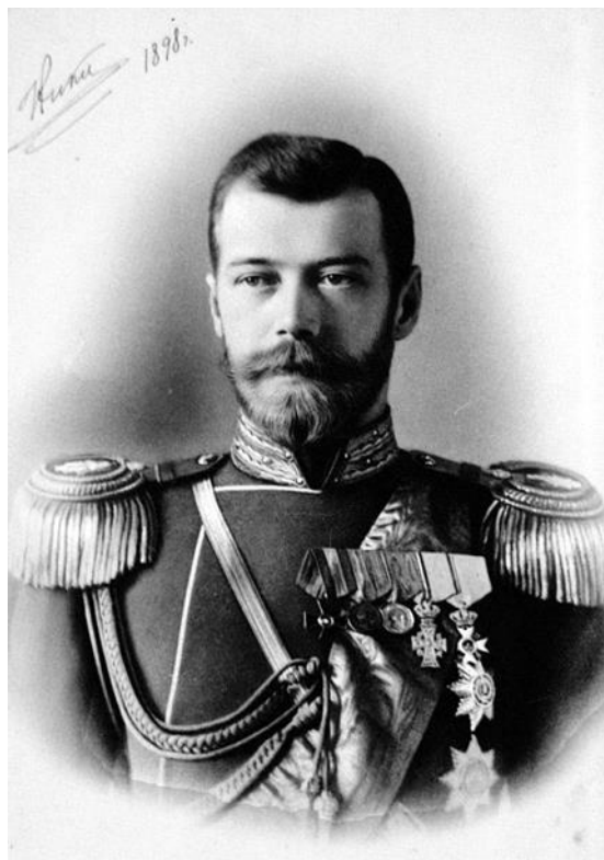
Car Mikołaj II Romanow