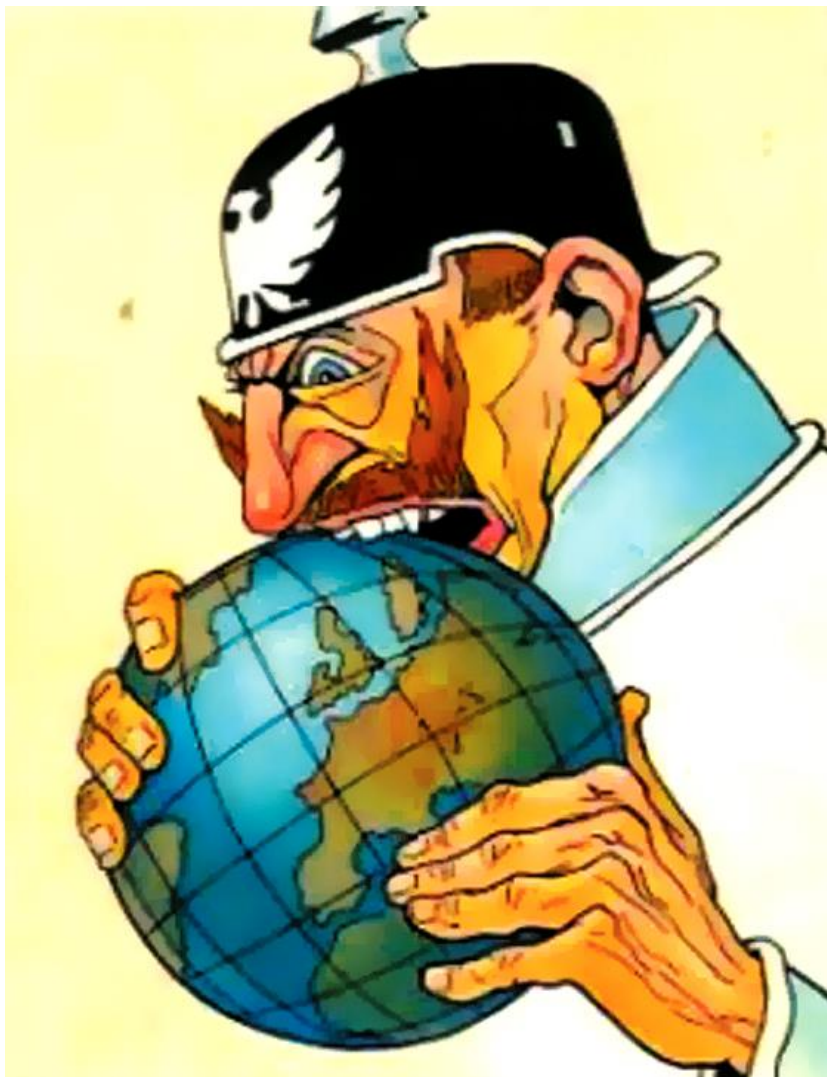
Cesarz Wilhelm II próbujący zjeść świat - karykatura francuska