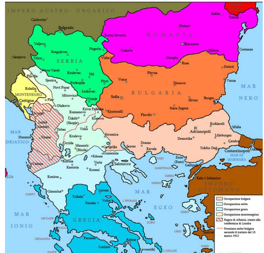
Podział terytorialny ustalony po I wojnie bałkańskiej