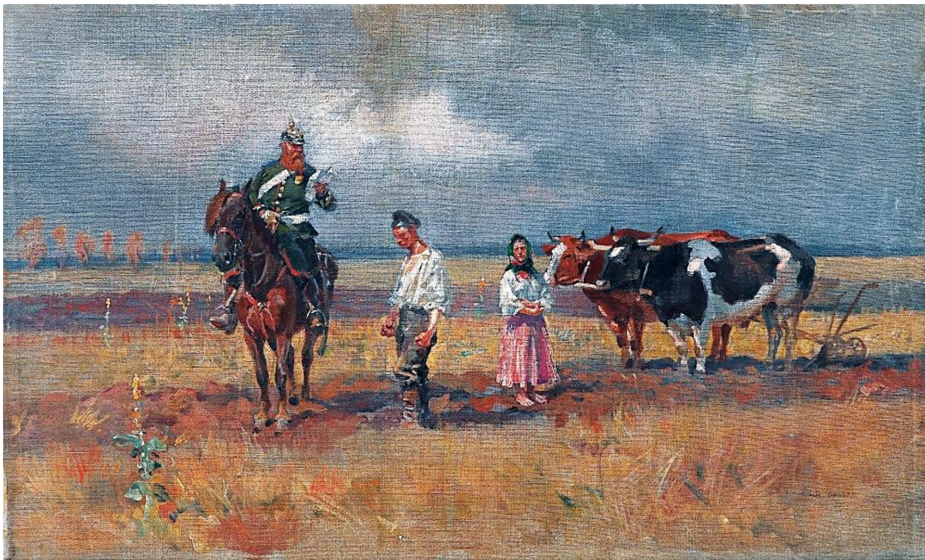
Rugi pruskie . Akcja wywołała powszechne oburzenie w Europie, a nawet protesty w samych Niemczech. Obraz Wojciecha Kossaka z 1909 r.