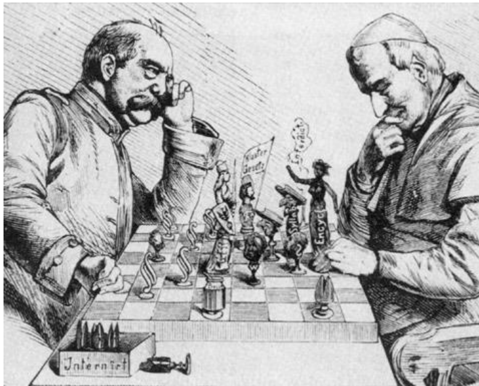
Karykatura polityki kulturkampfu – Bismarck rozgrywający partię szachów z papieżem, autor nieznany, ok. 1875 r.