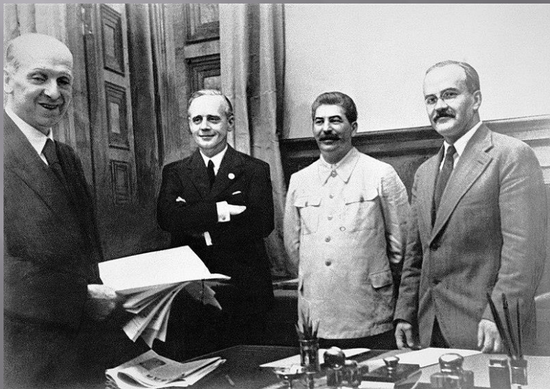
23 sierpnia 1939 r. w Moskwie. Od lewej Friedrich Gaus, Joachim von Ribbentrop, Józef Stalin Wiaczesław Mołotow.