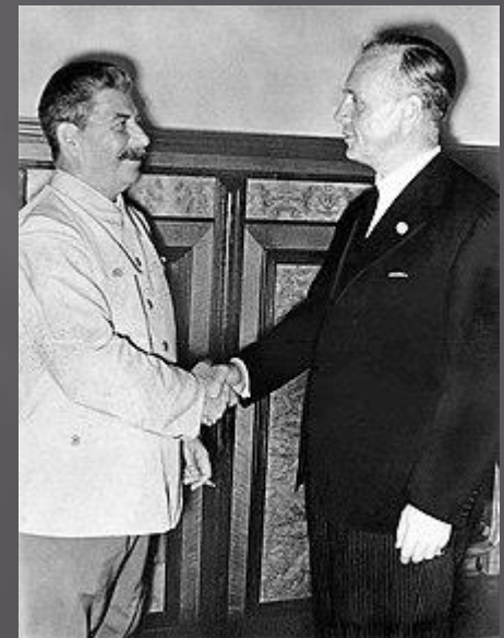
Józef Stalin z Joachimem von Ribbentropem