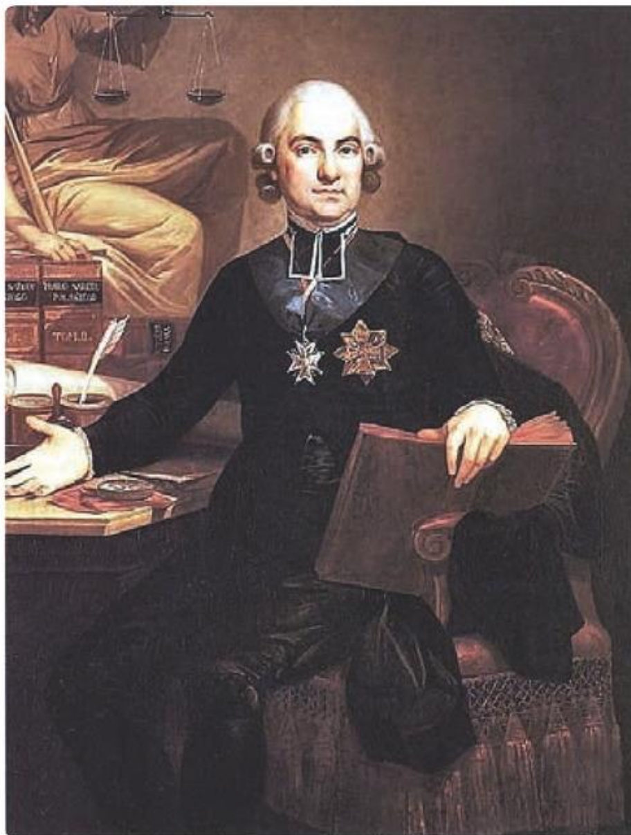
Ksiądz Hugo Kołłątaj. Portret z 1791 r.