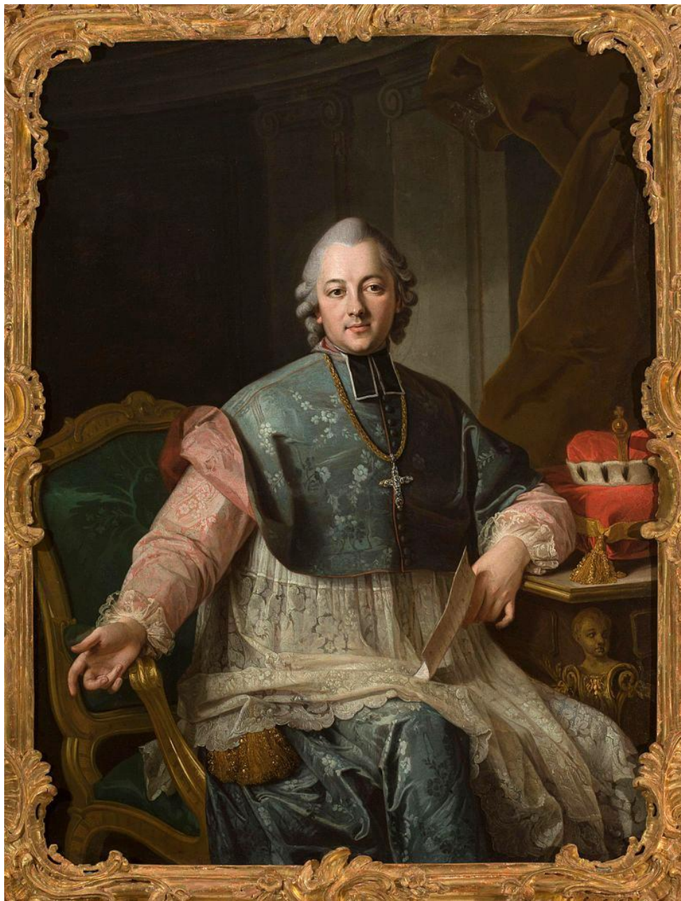
Ignacy Krasicki (1735–1801), biskup warmiński, poeta, prozaik i publicysta.