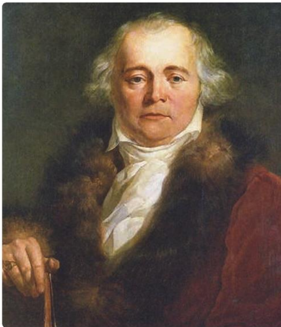
Julian Ursyn Niemcewicz. Portret z 1822 r.