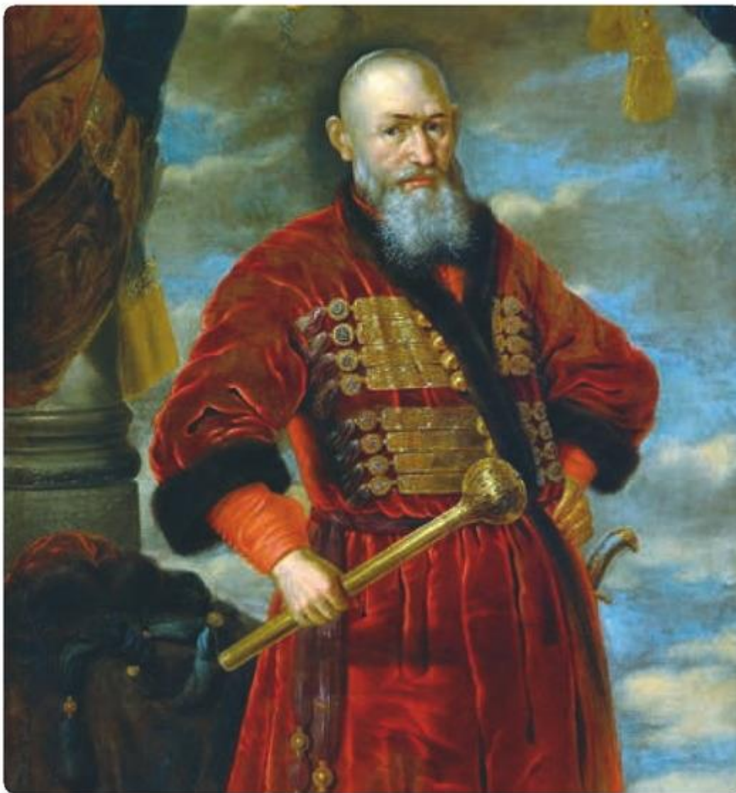
Stefan Czarniecki. Portret z XVII w.