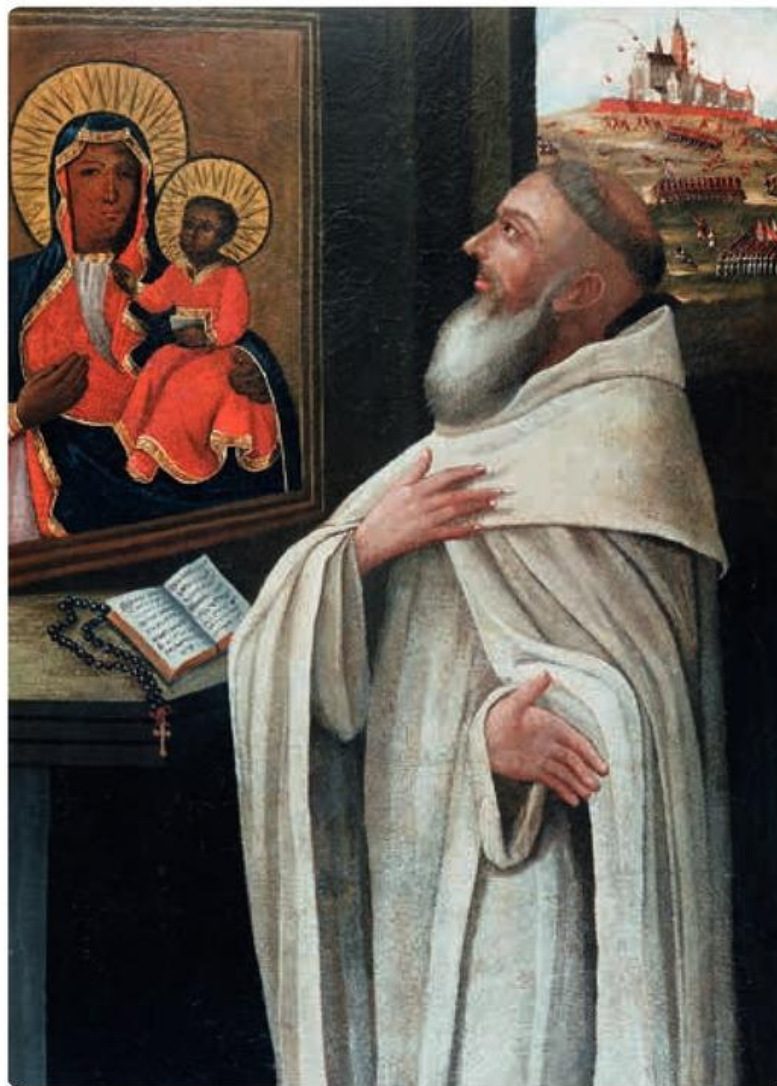
Ojciec Augustyn Kordecki – przeor (tzn. przełożony) klasztoru paulinów na Jasnej Górze i dowódca jego obrony przed Szwedami. Obraz z XVII w.