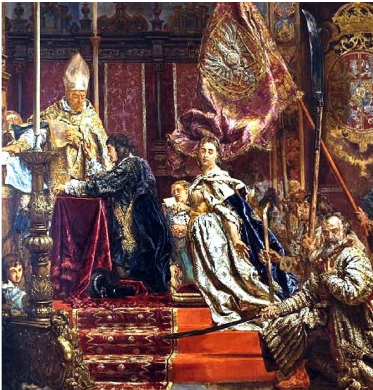
Jan Matejko, Śluby Jana Kazimierza. Król klęczy przed ołtarzem katedry we Lwowie. U dołu po prawej przyklęka na jedno kolano Stefan Czarniecki.