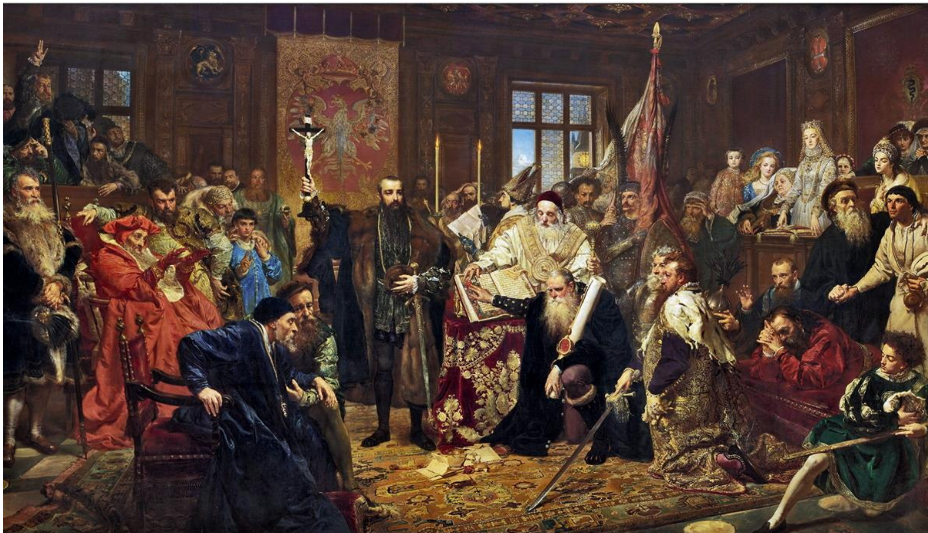
Jan Matejko, Unia lubelska . Z krzyżem w ręku stoi Zygmunt August. Obraz został namalowany z okazji 300-lecia zawarcia unii.