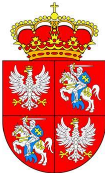
Herb Rzeczypospolitej Obojga Narodów