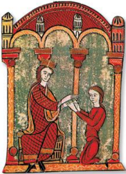
Wasal składający hołd lenny swojemu panu (średniowieczny fresk)

Hołd lenny – uroczysta ceremonia, podczas której wasal klękał przed swoim seniorem i składał mu uroczystą przysięgę wierności.