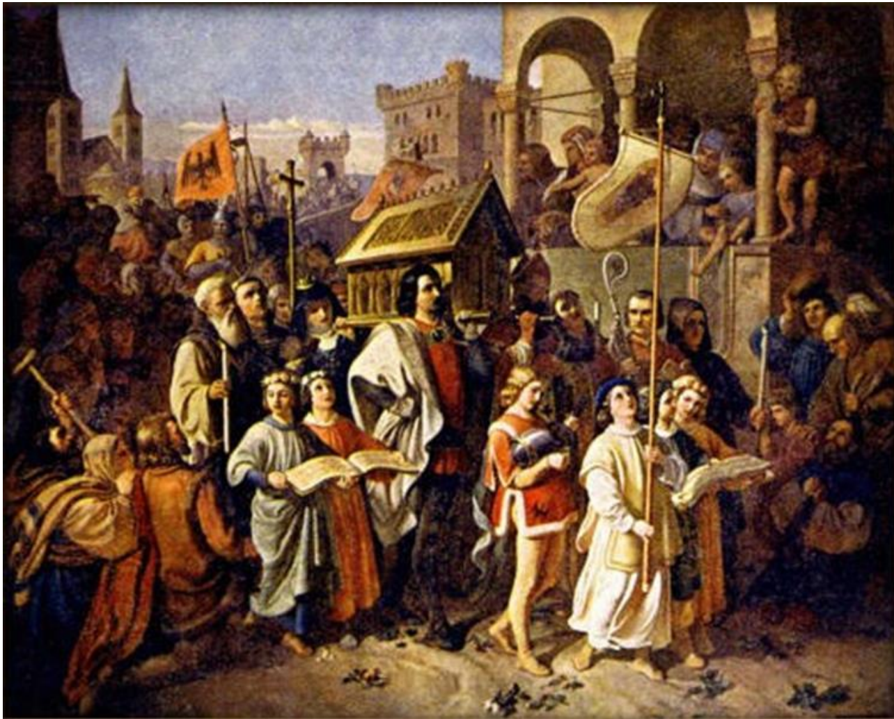
Przeniesienie szczątków biskupa Wojciecha do Pragi po najeździe Brzetysława na Polskę