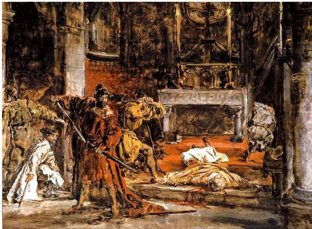
Śmierć przy ołtarzu. Jan Matejko