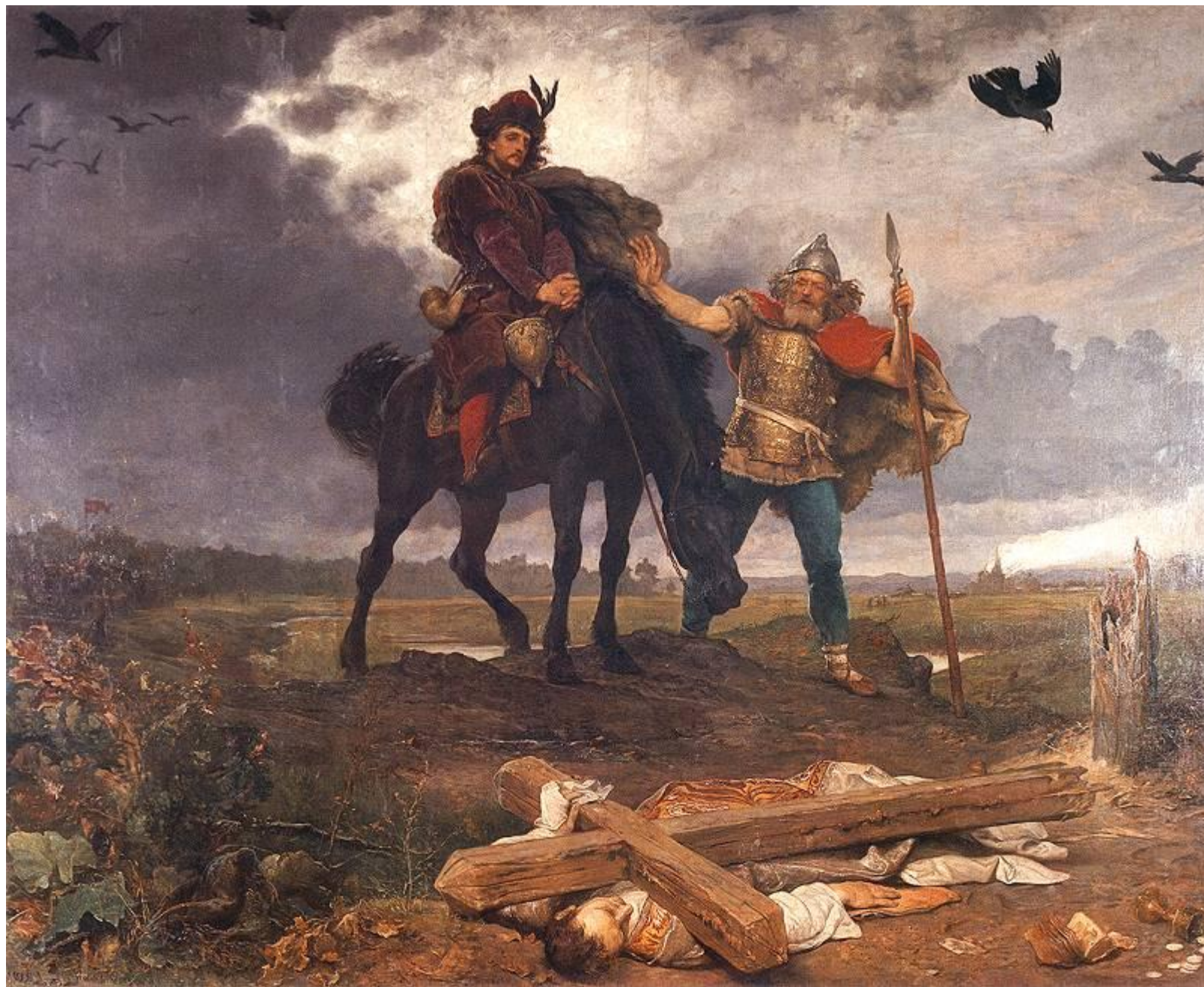
Obraz Wojciecha Gersona przedstawiający księcia Kazimierza I Odnowiciela powracającego do zniszczonego kraju.