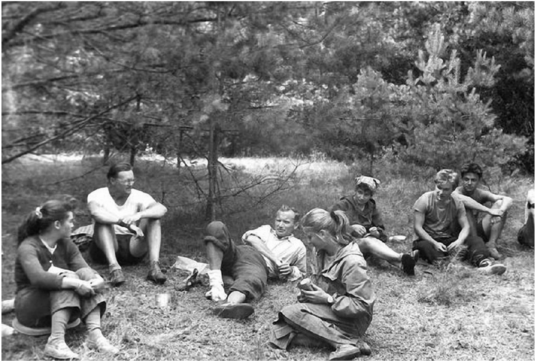
Ksiądz Karol Wojtyła (leży wsparty na łokciu) podczas biwaku ze studentami. Zdjęcie z września 1956 r.