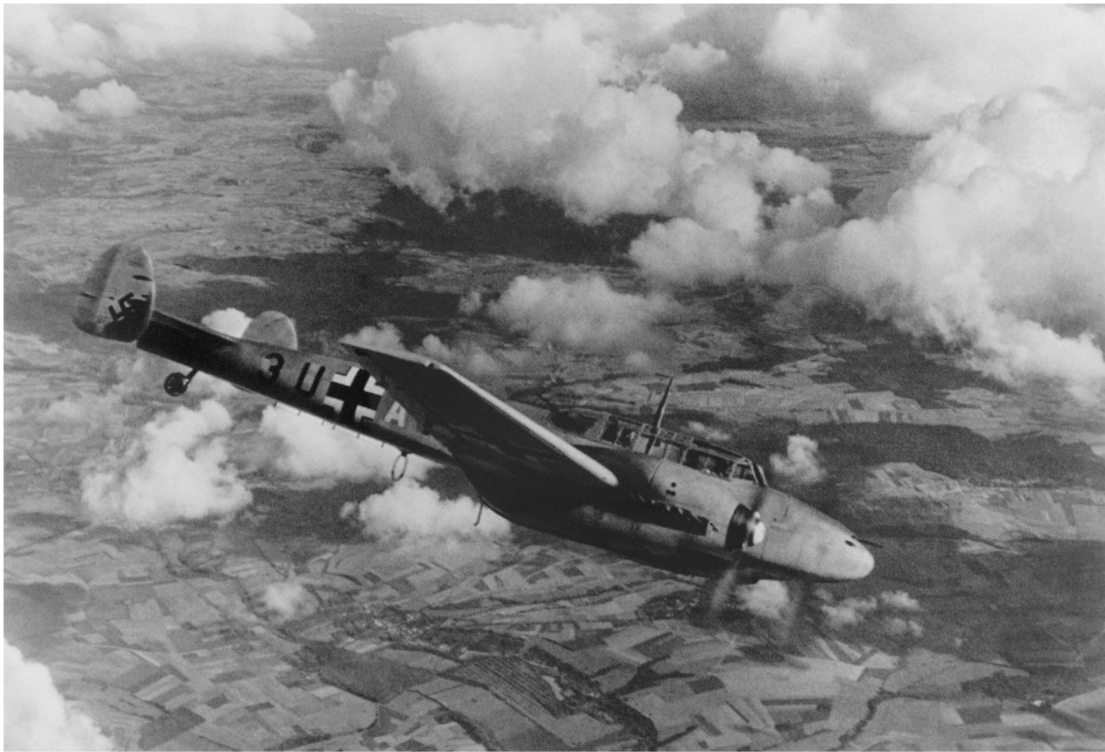
Niemiecki bombowiec nad Polską we wrześniu 1939 r.