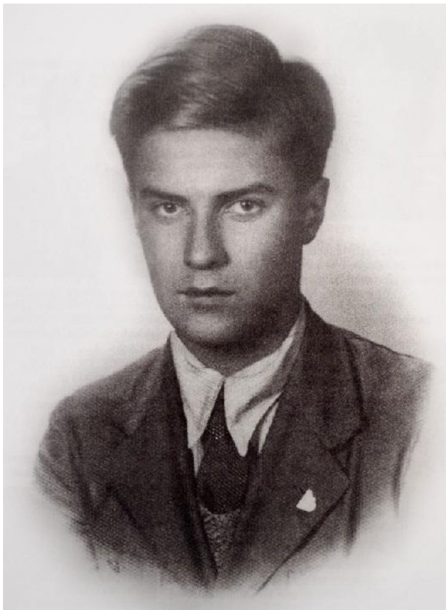
Tadeusz Zawadzki „Zośka”