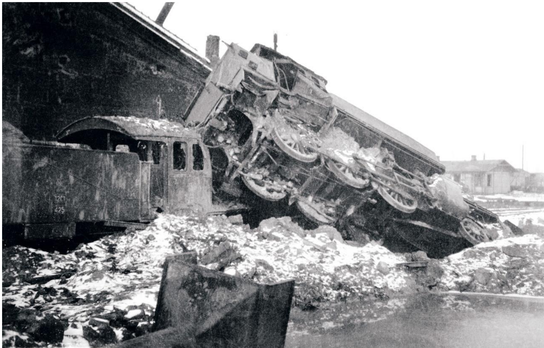
Niemiecka lokomotywa wykolejona przez polski ruch oporu.