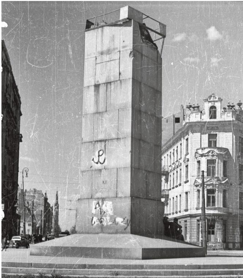
Kotwica Polski Walczącej na pomniku Lotnika w Warszawie. W 1942 r. namalował ją jeden z harcerzy Szarych Szeregów. Z drugiej strony pomnika podobną kotwicę wykonał „Rudy”.