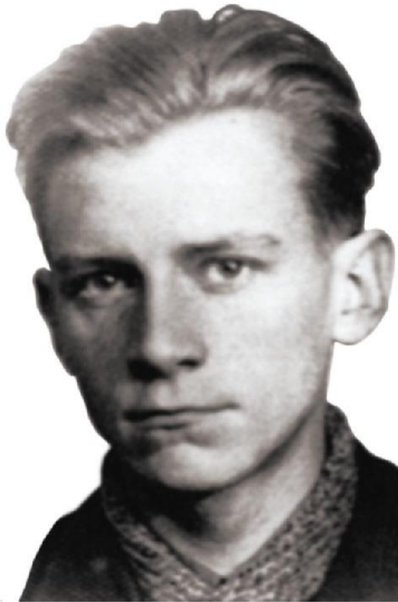
Jan Bytnar „Rudy”