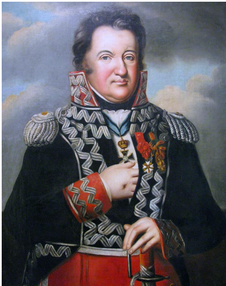
Jan Henryk Dąbrowski (2 VIII 1755 – 6 VI 1818)