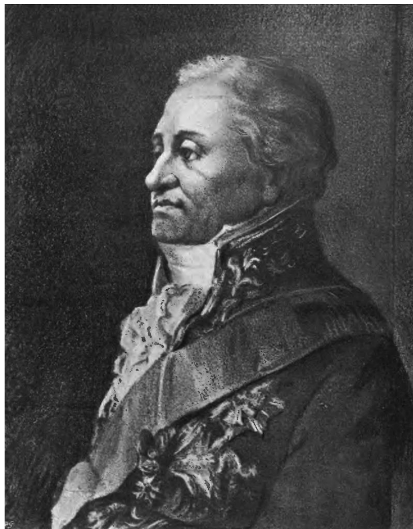
Józef Wybicki (29 IX 1747 – 10 III 1822)