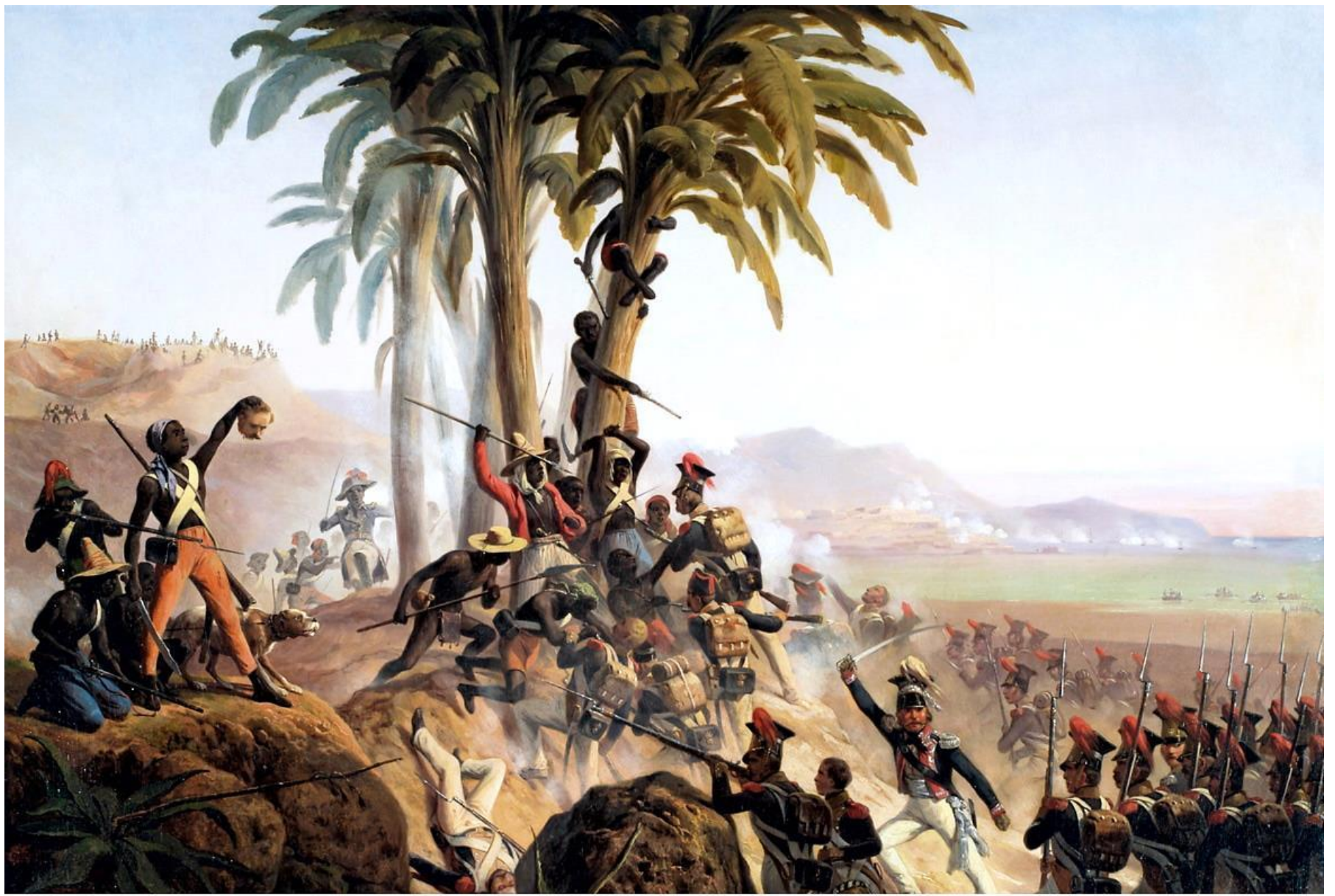
Bitwa polskich legionistów na Santo Domingo. Fragment obrazu z XIX w. Większość żołnierzy wysłanych tam przez Napoleona zginęła w walkach lub zmarła z powodu chorób tropikalnych. Niektórzy pozostali na wyspie.