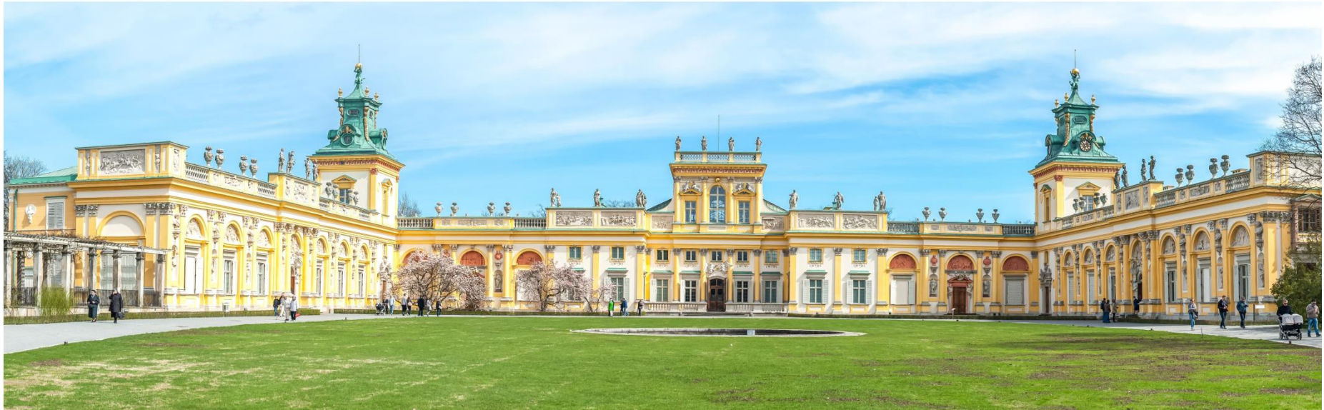
Pałac w Wilanowie