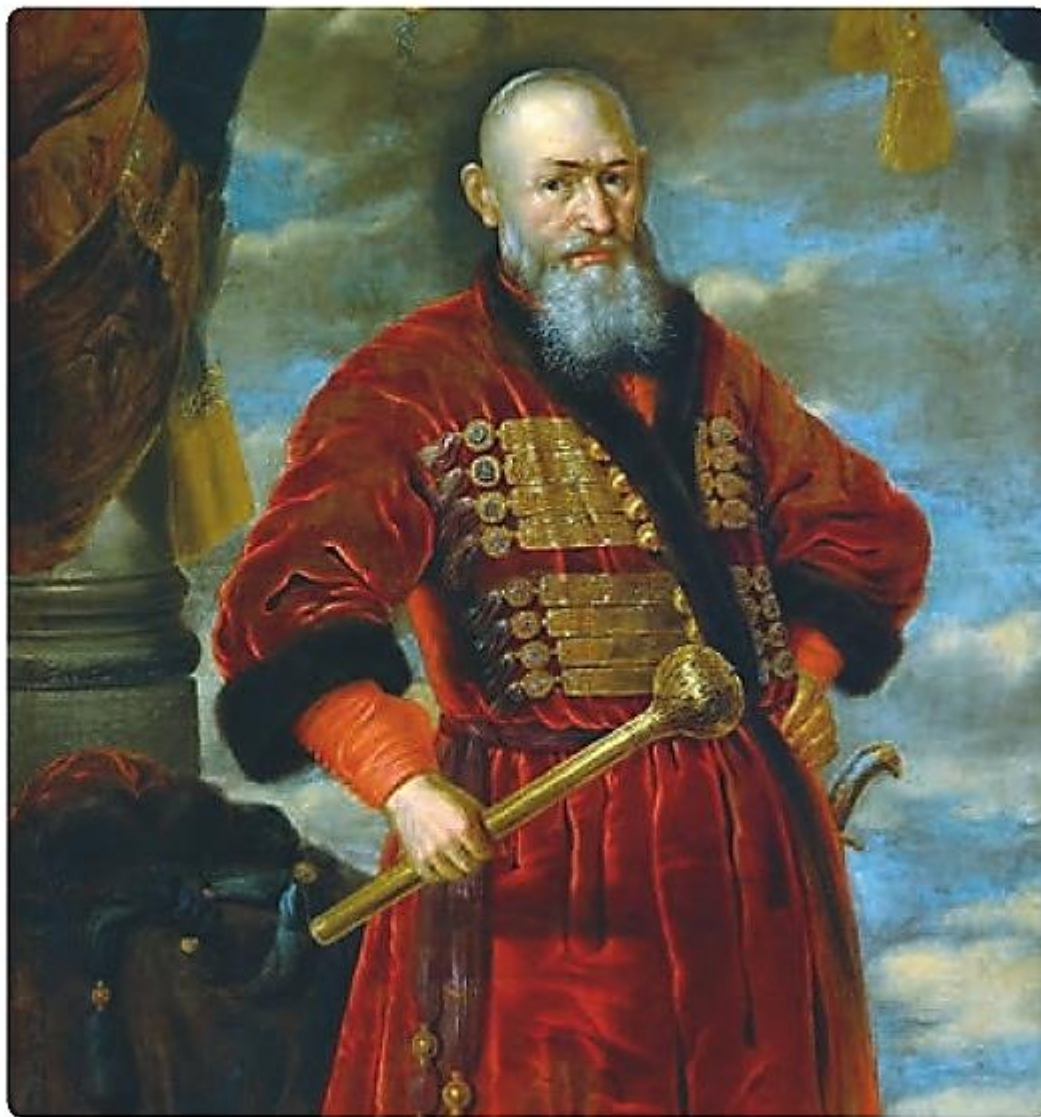
Stefan Czarniecki. Portret z XVII w.