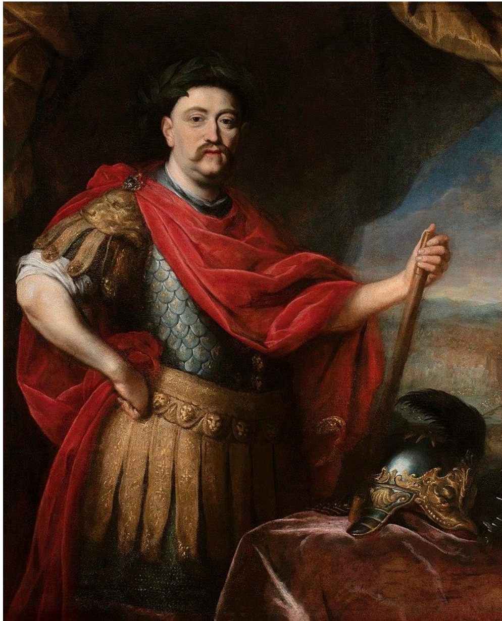
Jan III Sobieski