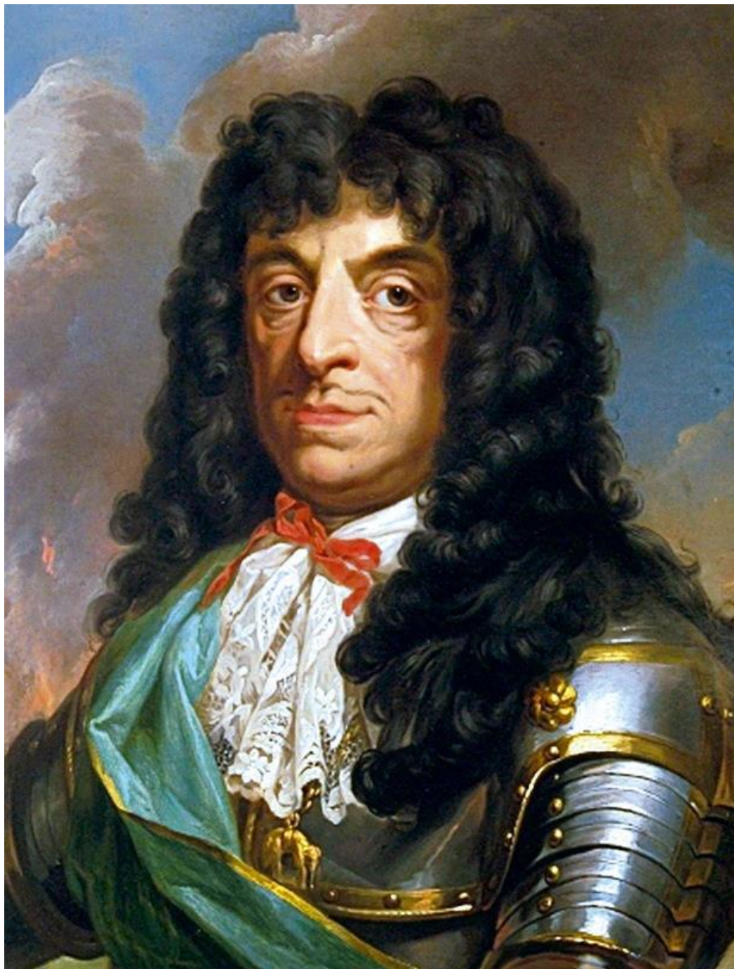
Król Jan Kazimierz