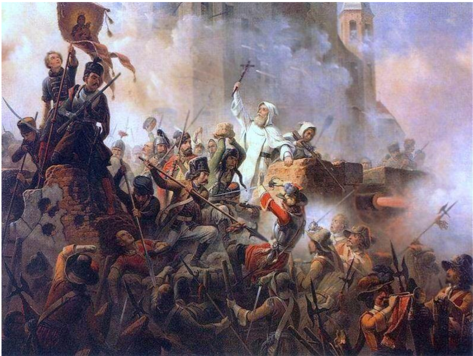
Obrona Jasnej Góry obraz Januarego Suchodolskiego