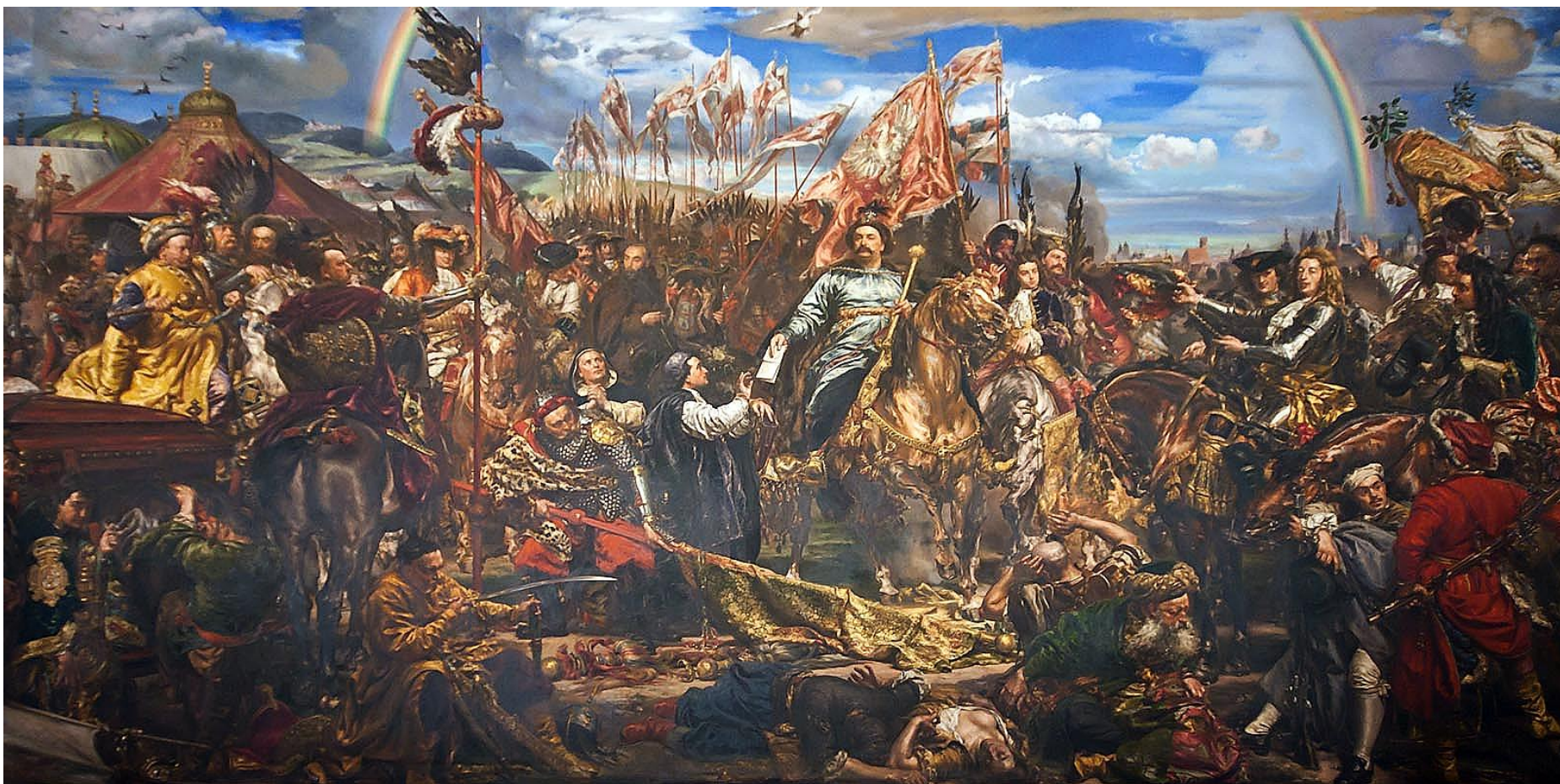
Jan III Sobieski wysyła wiadomość o zwycięstwie papieżowi Innocentemu XI Jan Matejko