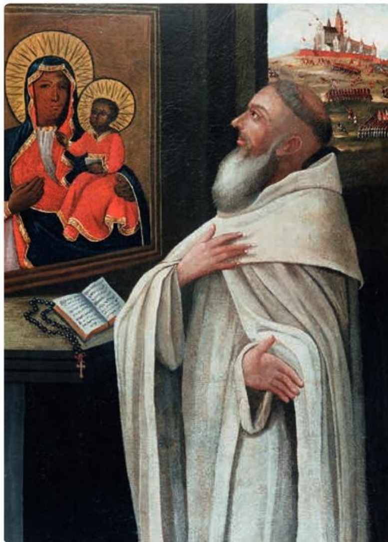
Ojciec Augustyn Kordecki – przeor (tzn. przełożony) klasztoru paulinów na Jasnej Górze i dowódca jego obrony przed Szwedami. Obraz z XVII w.