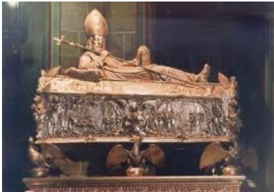
Barokowy relikwiarz św. Wojciecha w bazylice gnieźnieńskiej