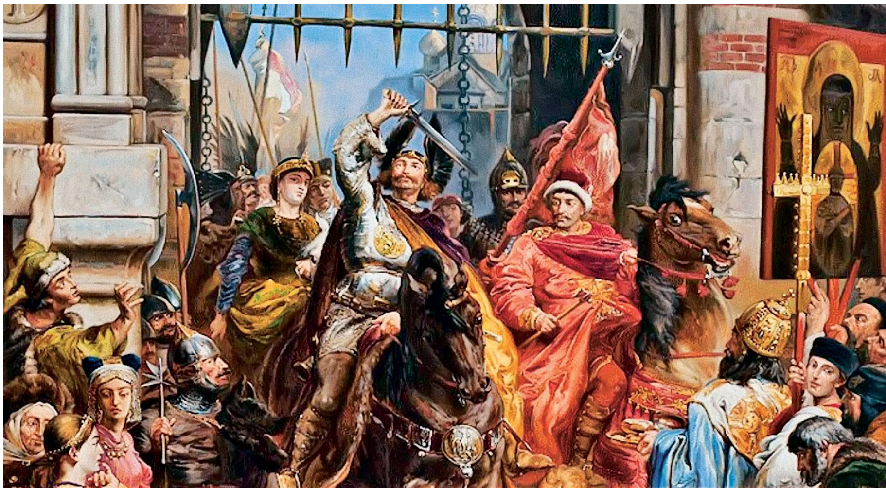
„Bolesław Chrobry ze Świętopelkiem przy Złotej Bramie w Kijowie”, Jan Matejko