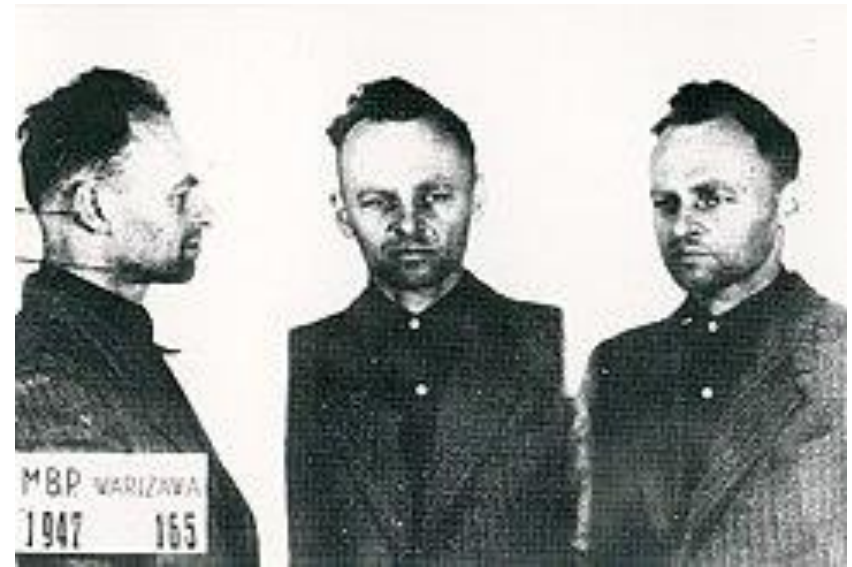
Witold Pilecki po aresztowaniu przez MBP. Więzienie mokotowskie (1947)