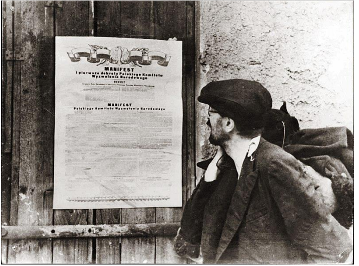
Zdjęcie propagandowe przedstawiające osobę czytającą Manifest