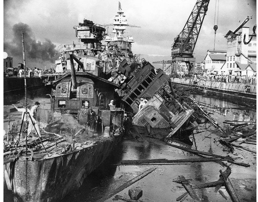
Photo # NH 64482 USS Cassin & Downes wrecked at Pearl Harbor, 7 December 1941

Do 1942 roku Japończycy zajęli Birnę, Filipiny, Indonezję, Malaje i większość wysp Oceanii.