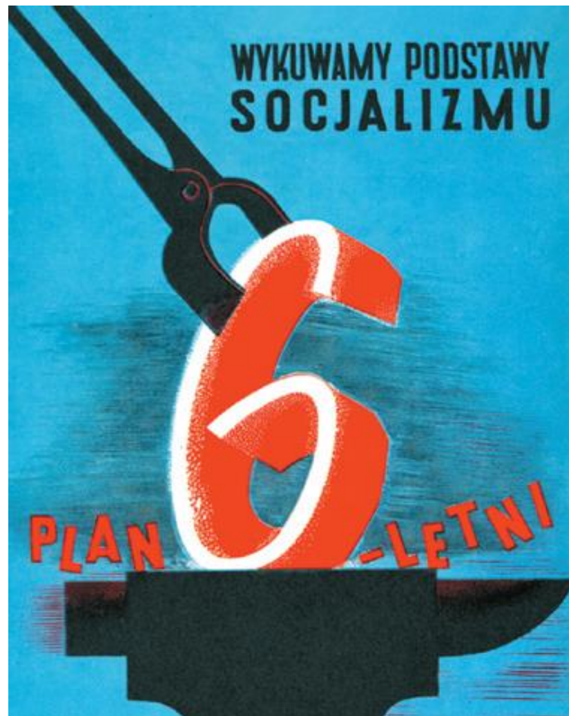
Plakat reklamujący plan sześcioletni.