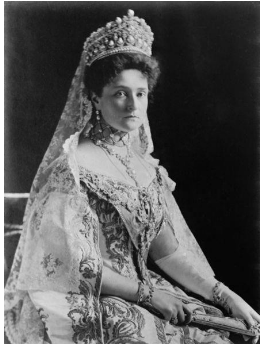
Aleksandra Fiodorowna Żona Mikołaja II