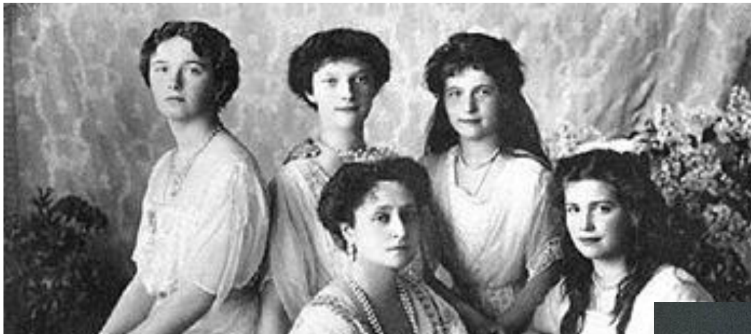
Caryca Aleksandra i córki: Olga, Tatiana, Maria i Anastazja