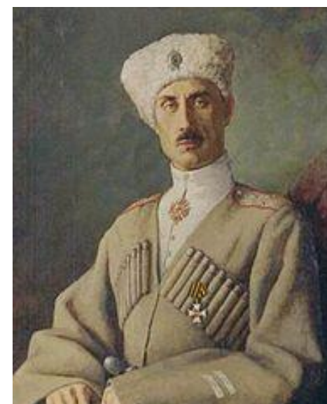
Piotr Nikołajewicz Wrangel