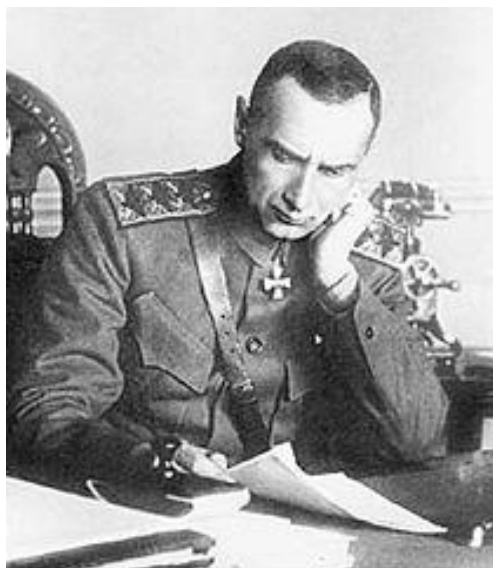
Aleksandr Wasiljewicz Kołczak