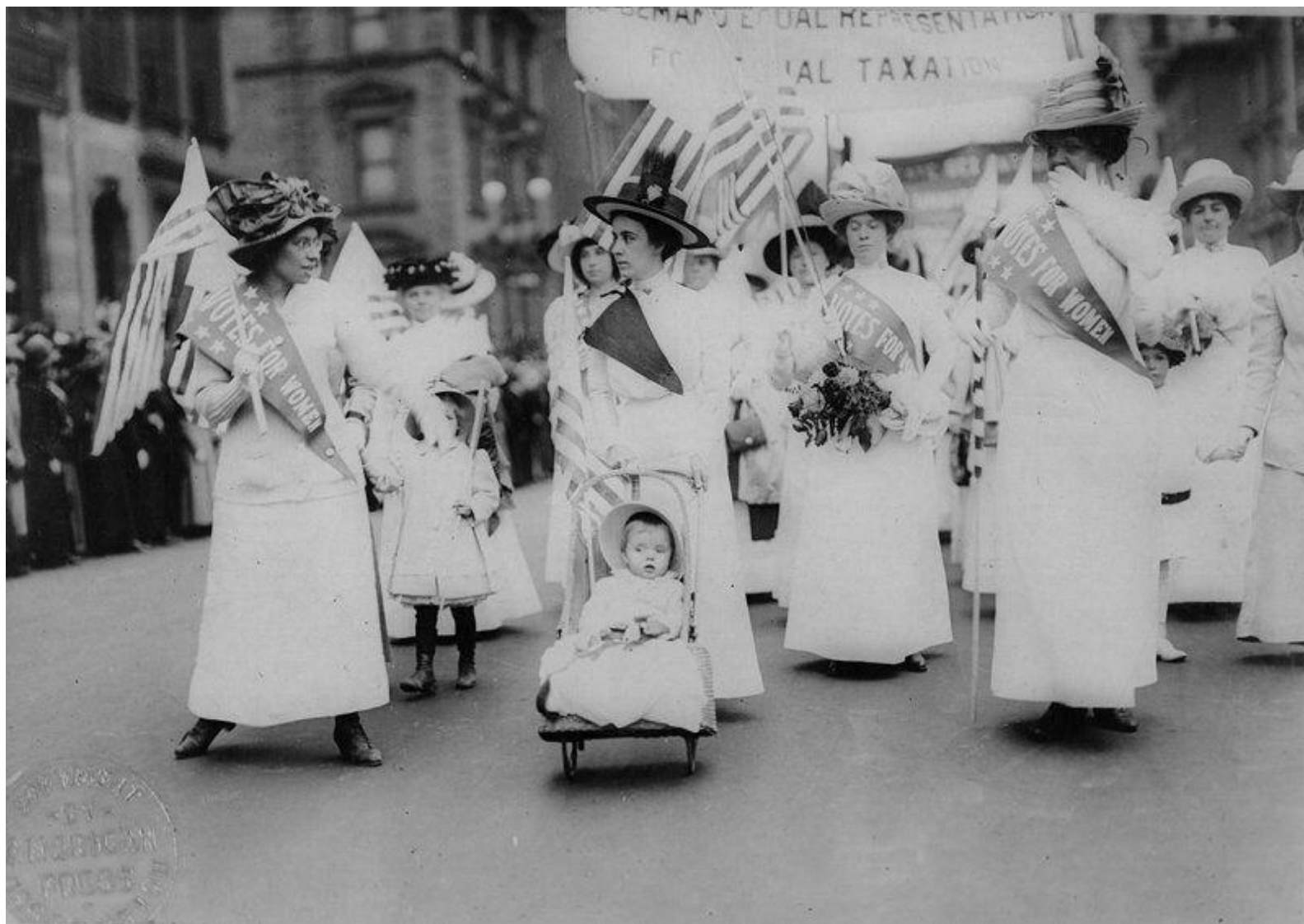
Parada sufrażystek w Nowym Jorku w roku 1912