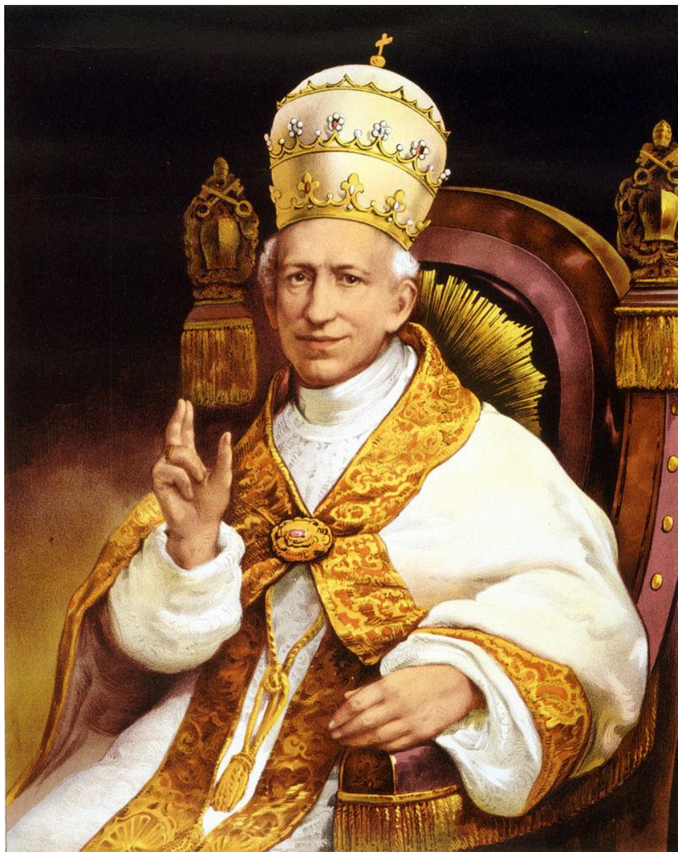
Papież Leon XIII