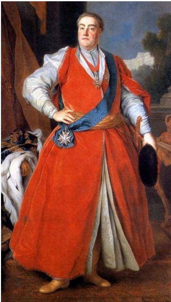
Portret króla Augusta III w stroju polskim Louis de Silvestre