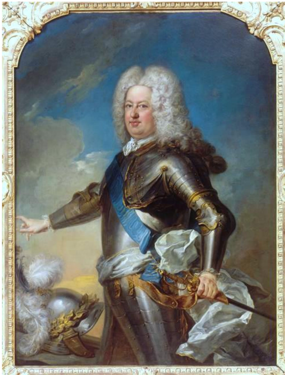
Stanisław Leszczyński Jean Baptiste van Loo