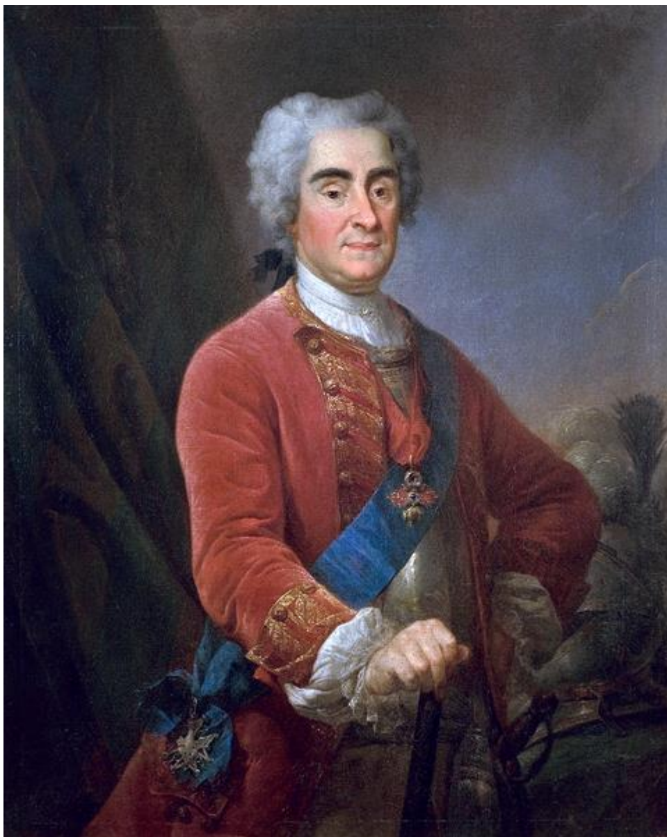
August II Mocny Marcello Bacciarelli