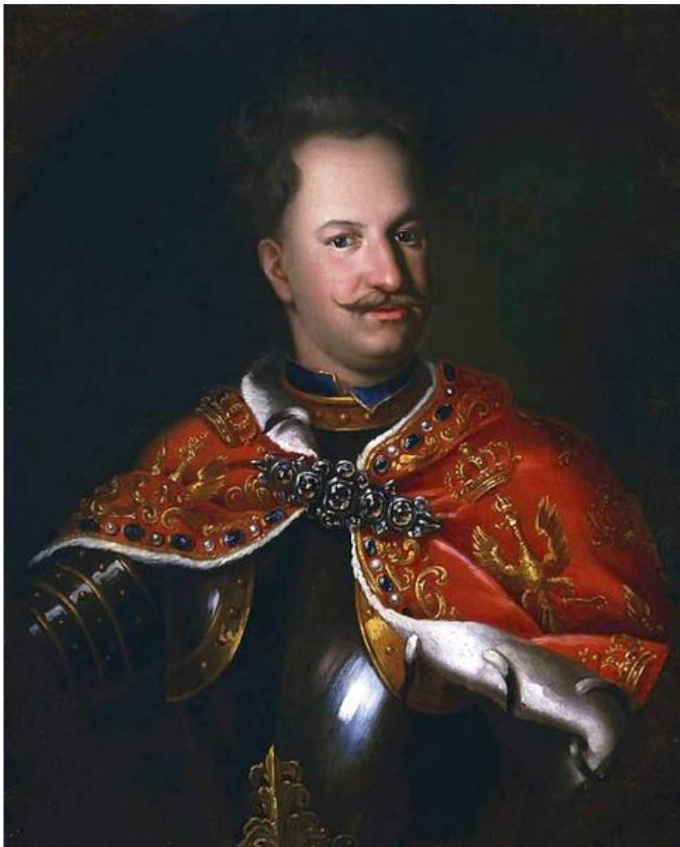
Portret Stanisława Leszczyńskiego Ádám Mányoki