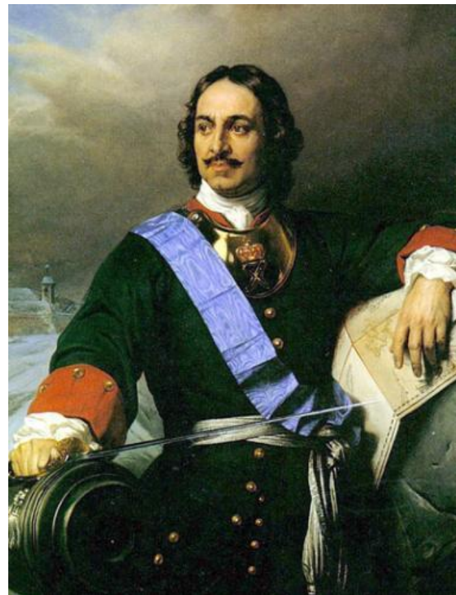
Car Piotr I Wielki