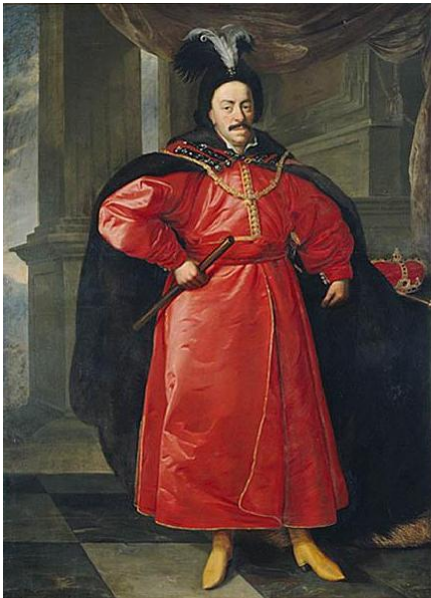
Jan II Kazimierz w polskim stroju, portret autorstwa Daniela Schultza, 1649 r.