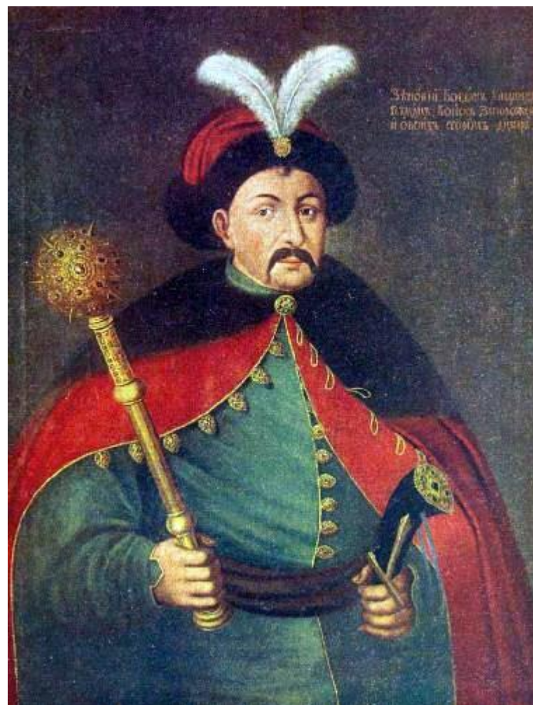
Bohdan Zenobi Chmielnicki