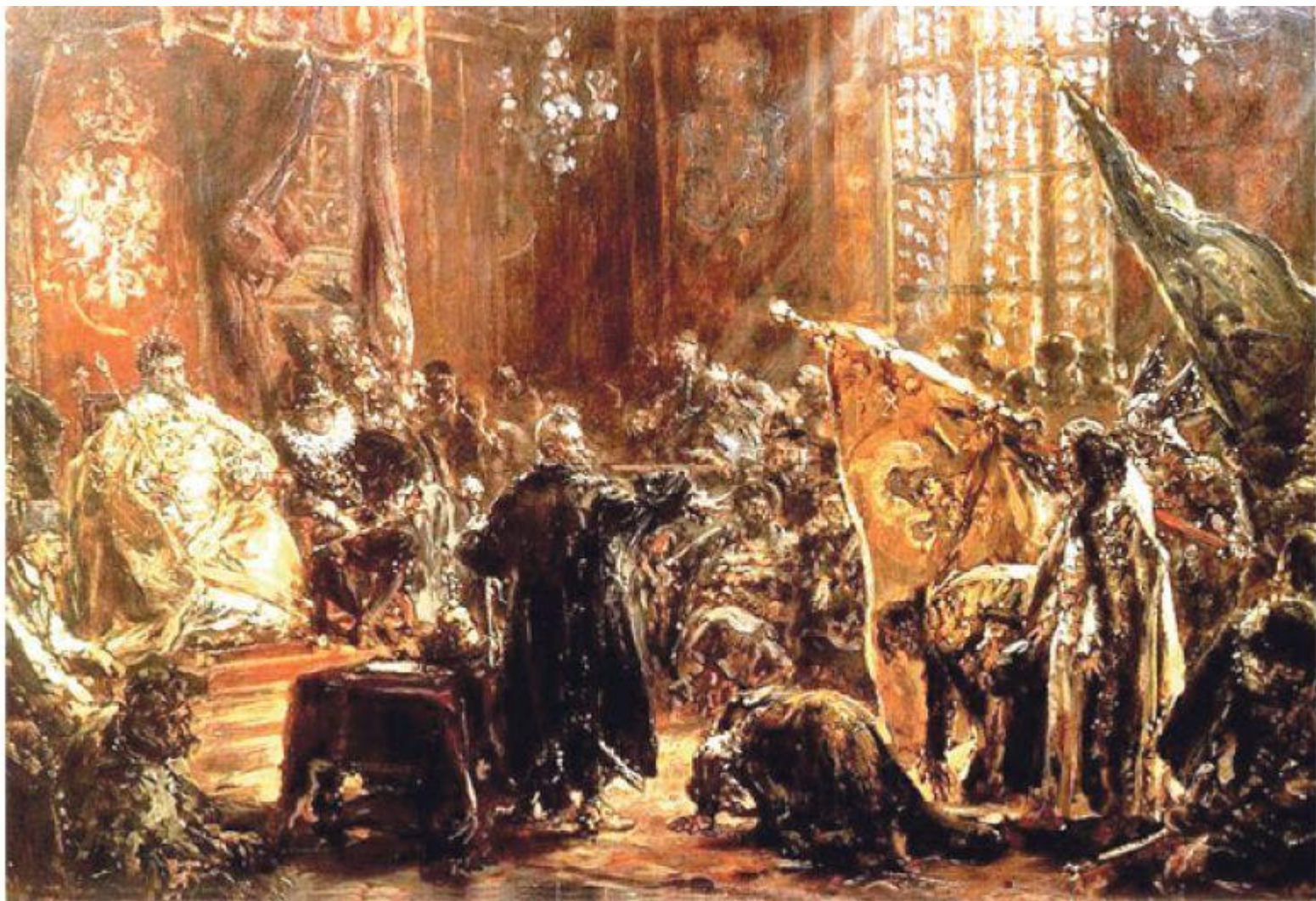
Carowie Szujscy na sejmie warszawskim. Jan Matejko