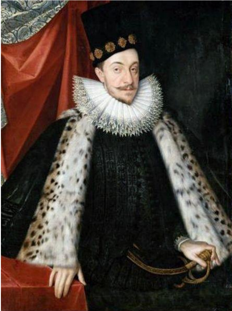
Zygmunt III Waza

Portret pędzla Marcina Kobera ok. 1590 r.