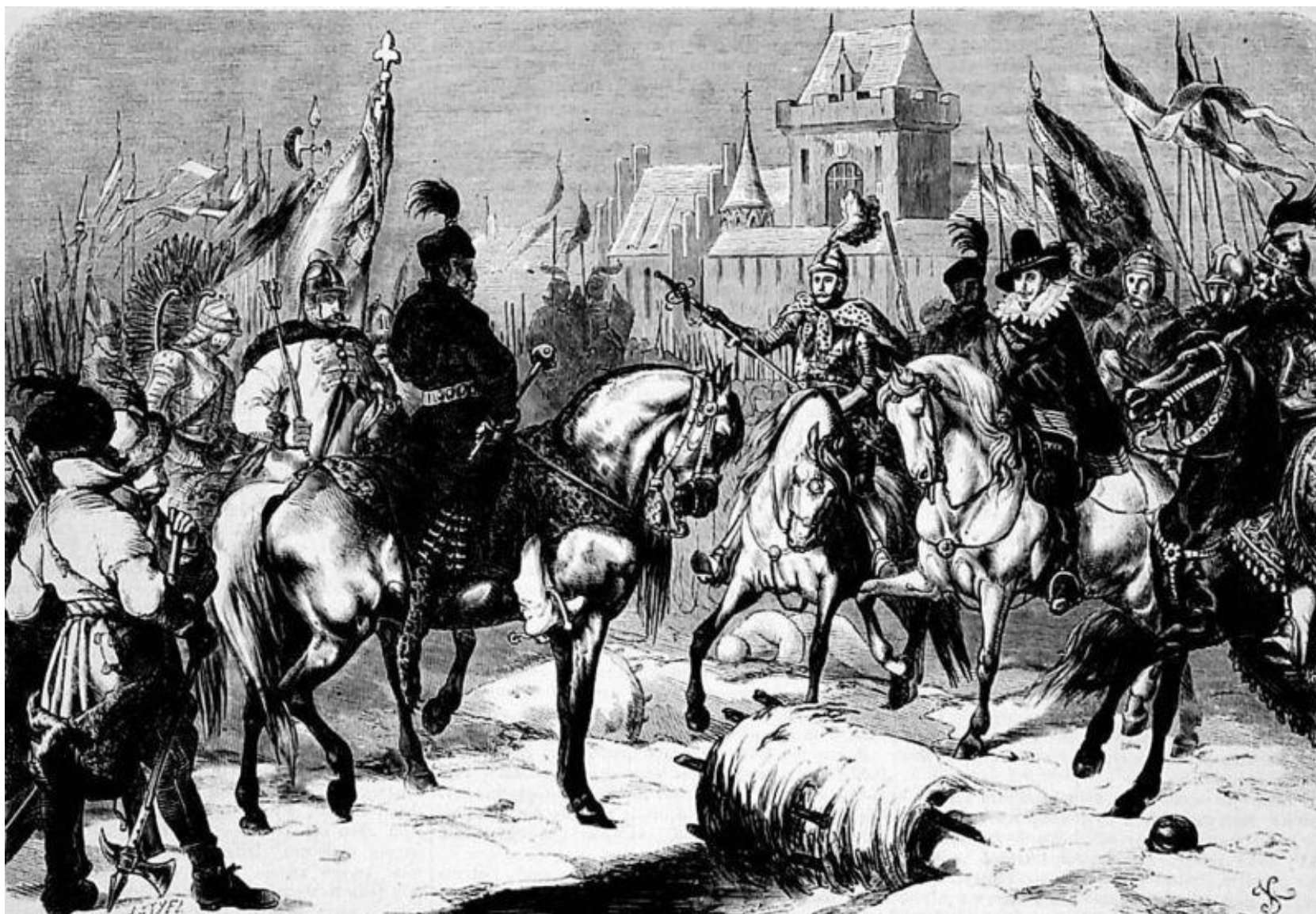
Kapitulacja Maksymiliana Habsburga pod Byczyną