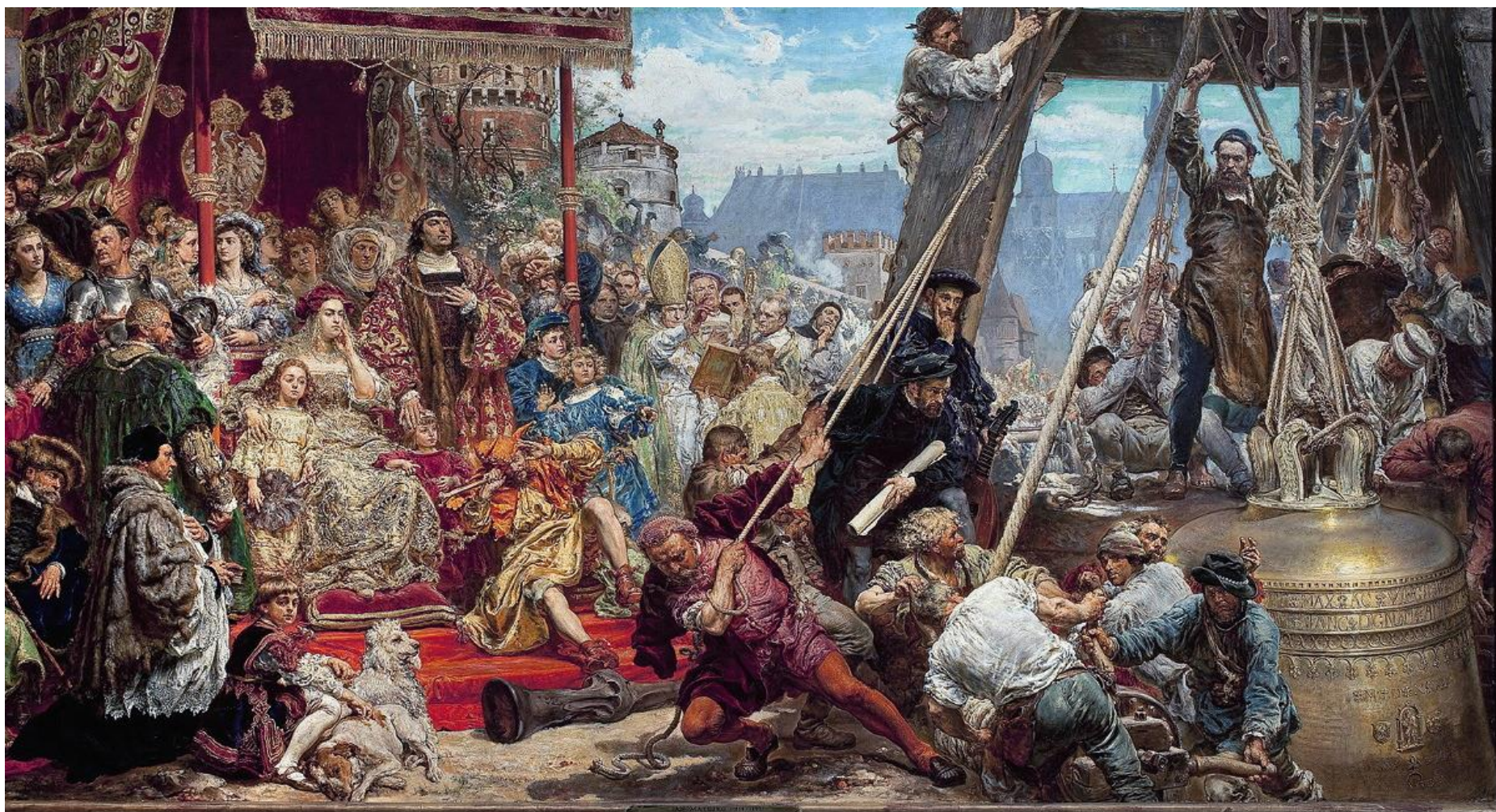
Jan Matejko, Zawieszenie dzwonu Zygmunta na wieży katedry w Krakowie w 1521 roku . Wbrew tytułowi obraz ukazuje wydobywanie odlanego dzwonu z formy, a nie zawieszenie go na wieży. Z lewej stoi Zygmunt Stary (w koronie) w otoczeniu dworu.