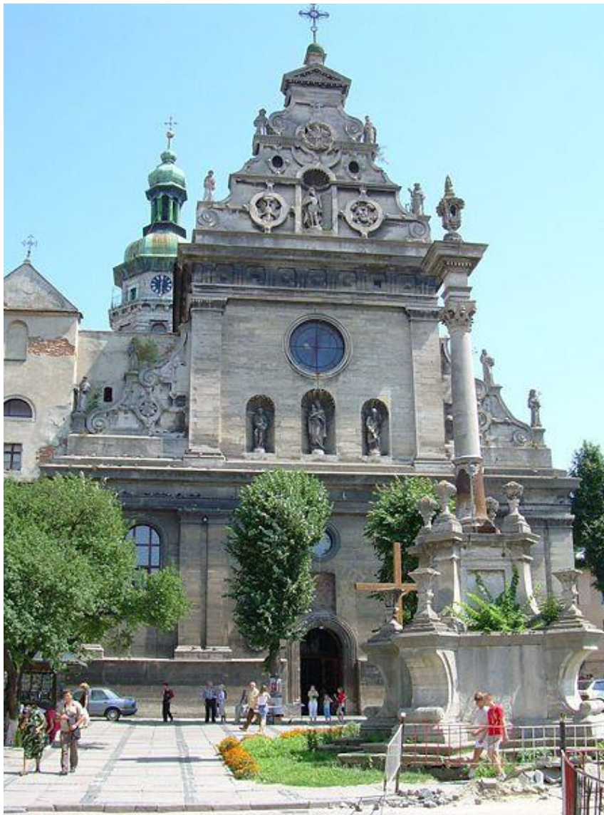
Kościół św. Andrzeja i klasztor Bernardynów