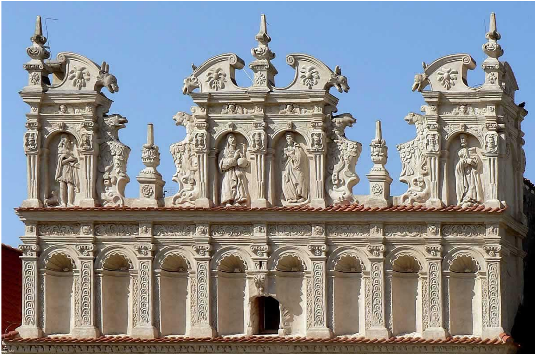
Kamienica Celejowska w Kazimierzu