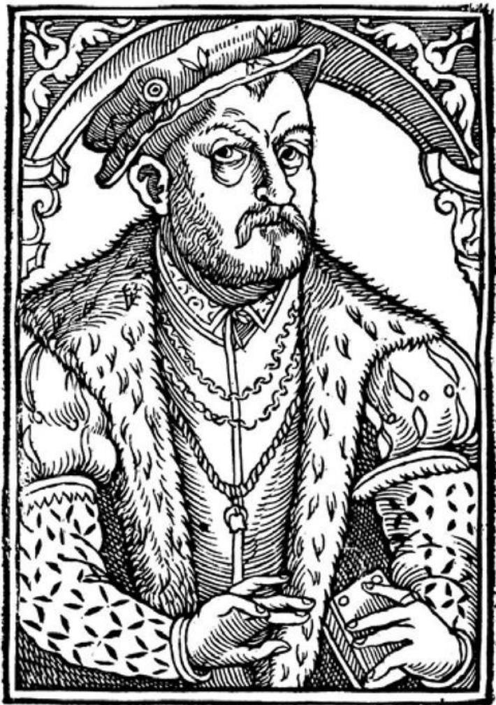
Mikołaj Rej. Rycina pochodzi z 1568 r., gdy Rej miał 63 lata.