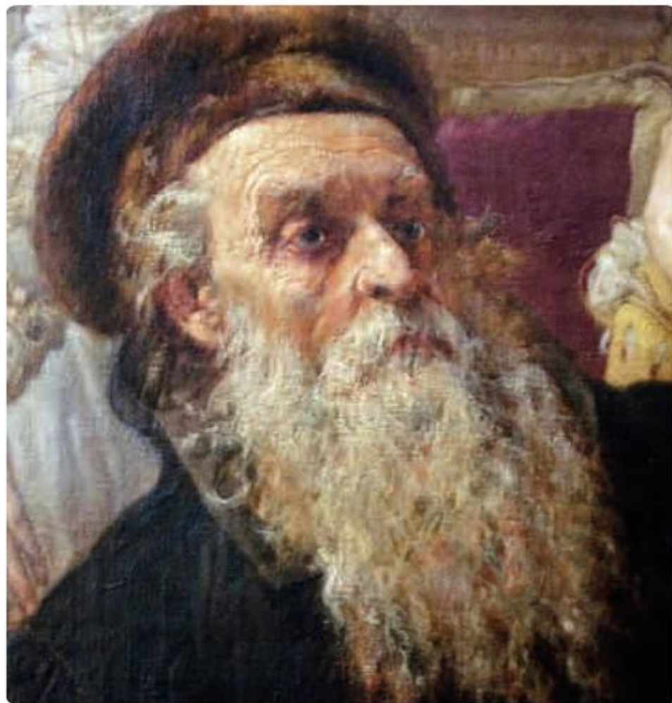
Andrzej Frycz Modrzewski. Fragment obrazu Jana Matejki Unia lubelska .