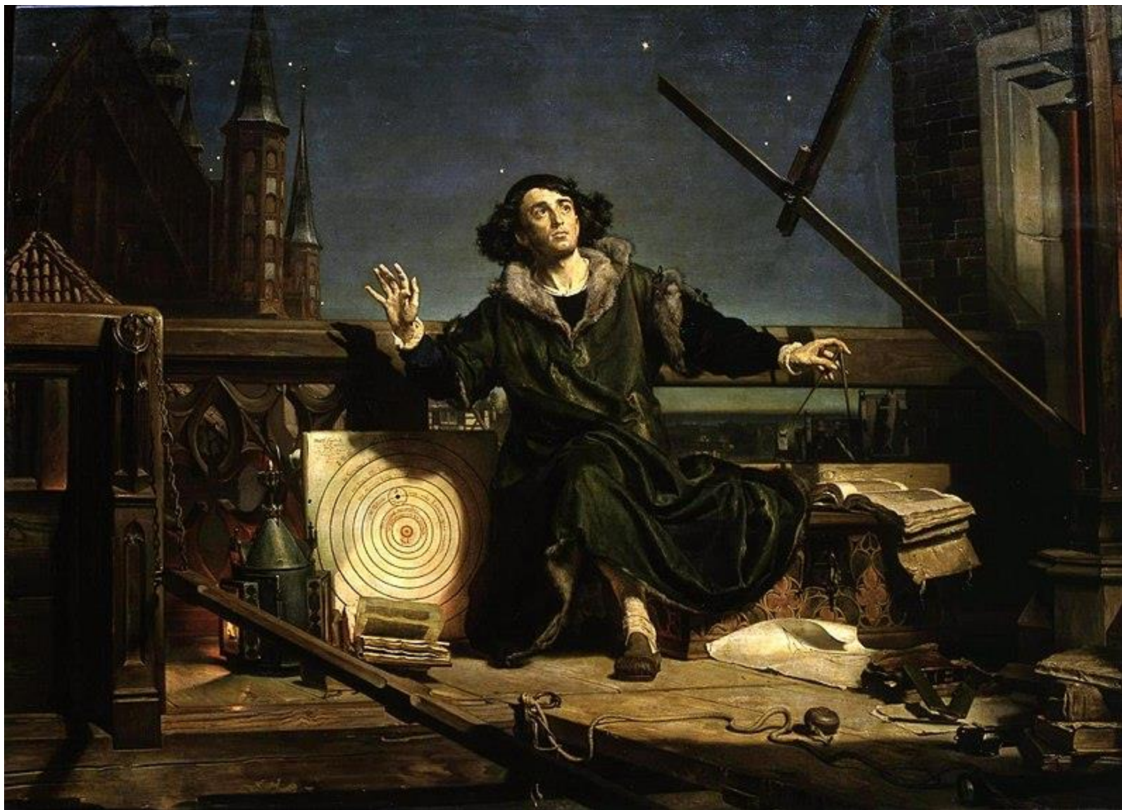
Astronom Kopernik, czyli rozmowa z Bogiem, obraz Jana Matejki