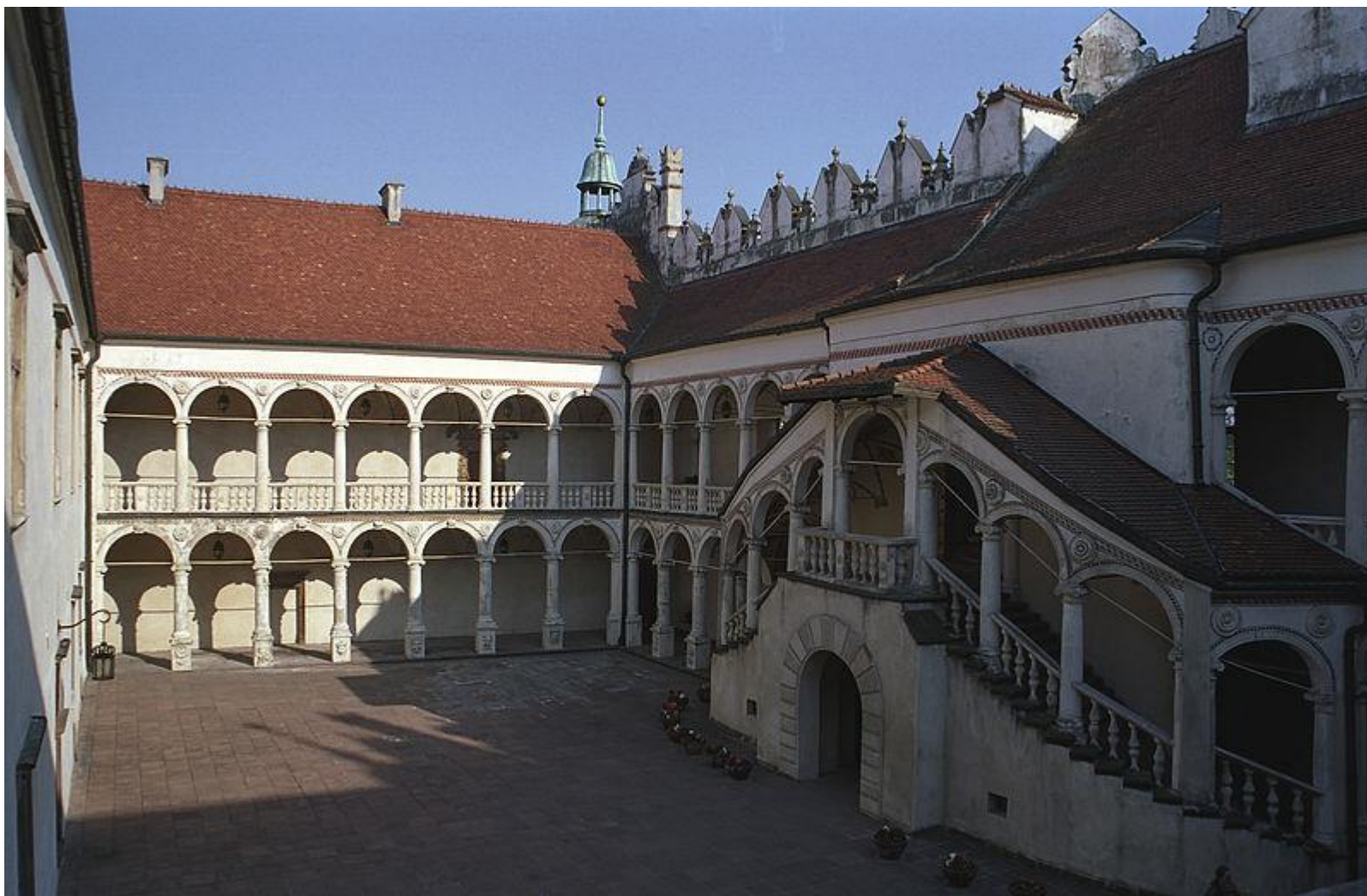
Zamek w Baranowie Sandomierskim