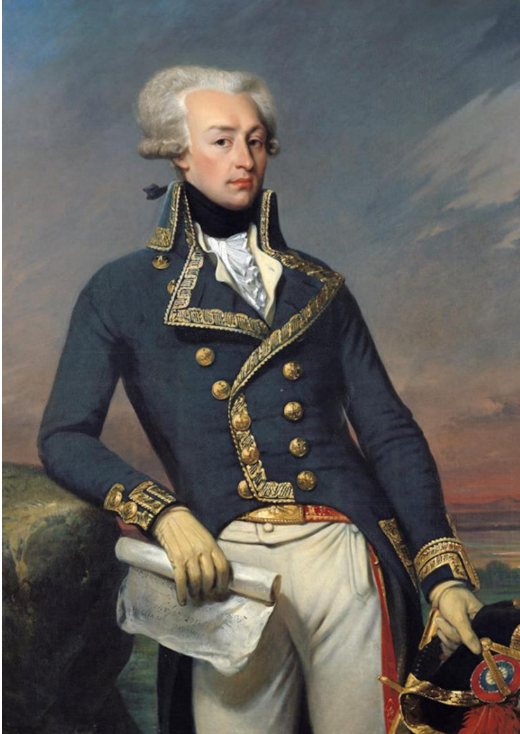
Józef La Fayette

Wkrótce uzbrojeni rewolucjoniści zorganizowali się w policję mieszczańską, zwaną Gwardią Narodową . Na jej czele stanął Józef La Fayette , słynny bohater walk o niepodległość Stanów Zjednoczonych.