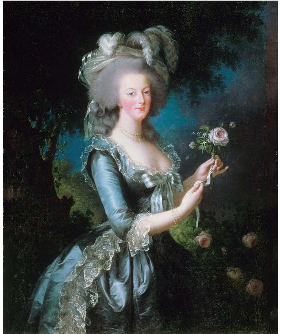
Maria Antonina Habsburg