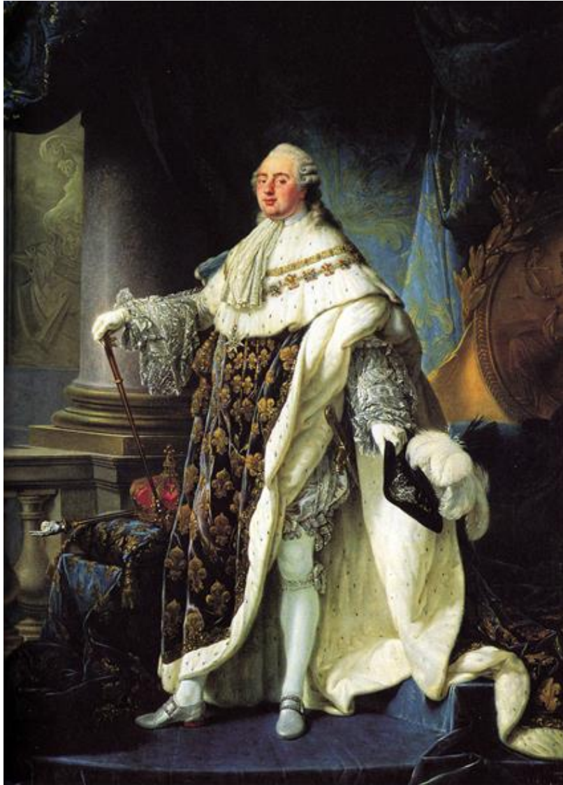
Ludwik XVI Burbon