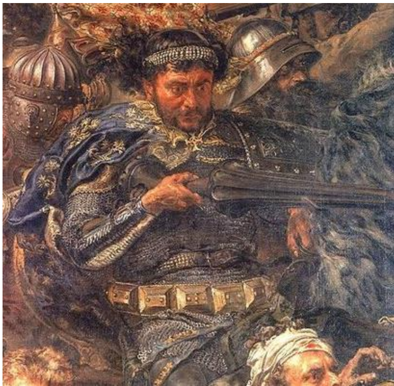
Zawisza Czarny (fragment obrazu Jana Matejki Bitwa pod Grunwaldem)

Urodził się ok. 1370 w Garbowie, zginął 12 czerwca 1428 w czasie bitwy z Turkami pod Galubacem.