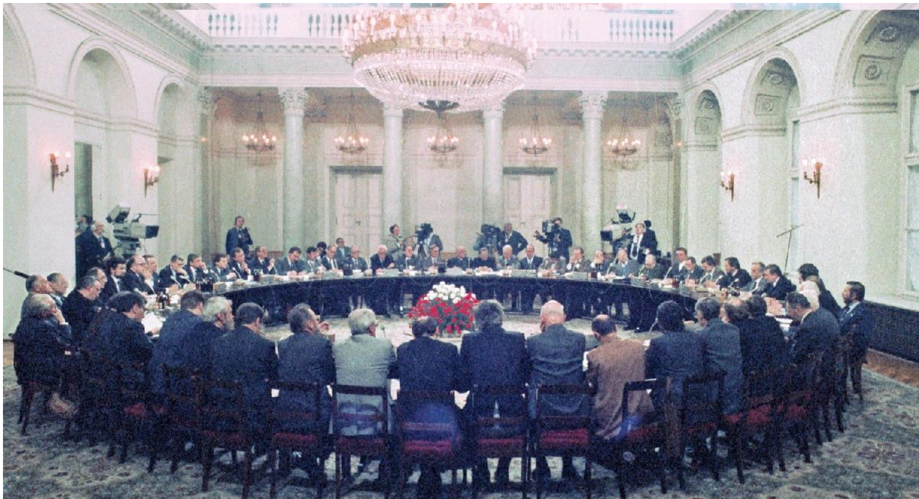
Początek rozmów okrągłego stołu w Warszawie w lutym 1989 r.