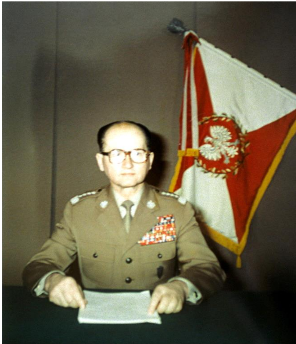
Generał Wojciech Jaruzelski ogłasza w telewizji wprowadzenie stanu wojennego 13 grudnia 1981 r.