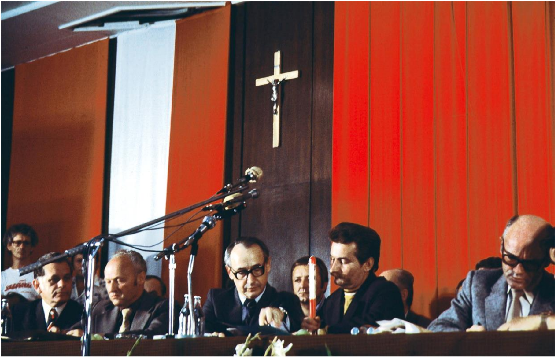
Lech Wałęsa podpisuje wielkim długopisem porozumienie w Stoczni Gdańskiej 31 sierpnia 1980 r.