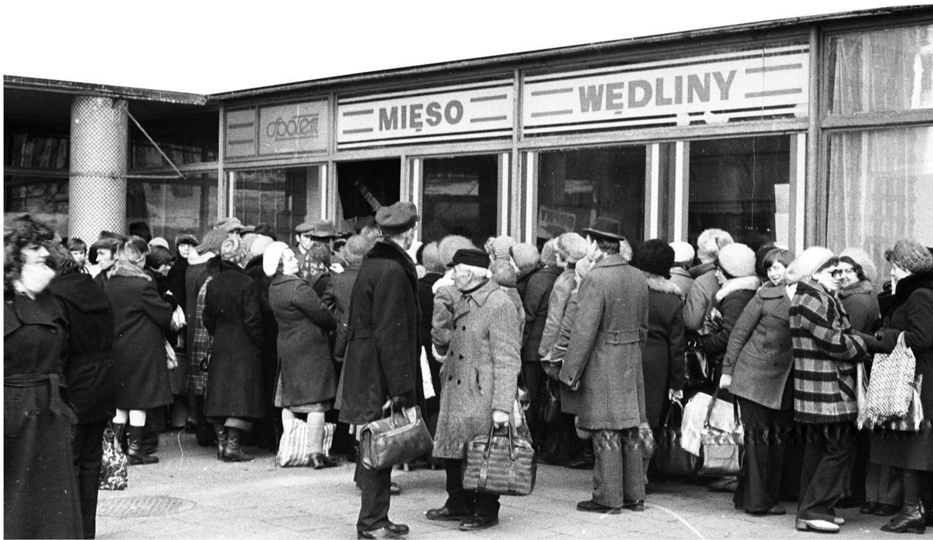
Kolejka do sklepu mięsnego w Warszawie. Ludzie spędzali w kolejkach długie godziny. Zdjęcie z 1978 r.