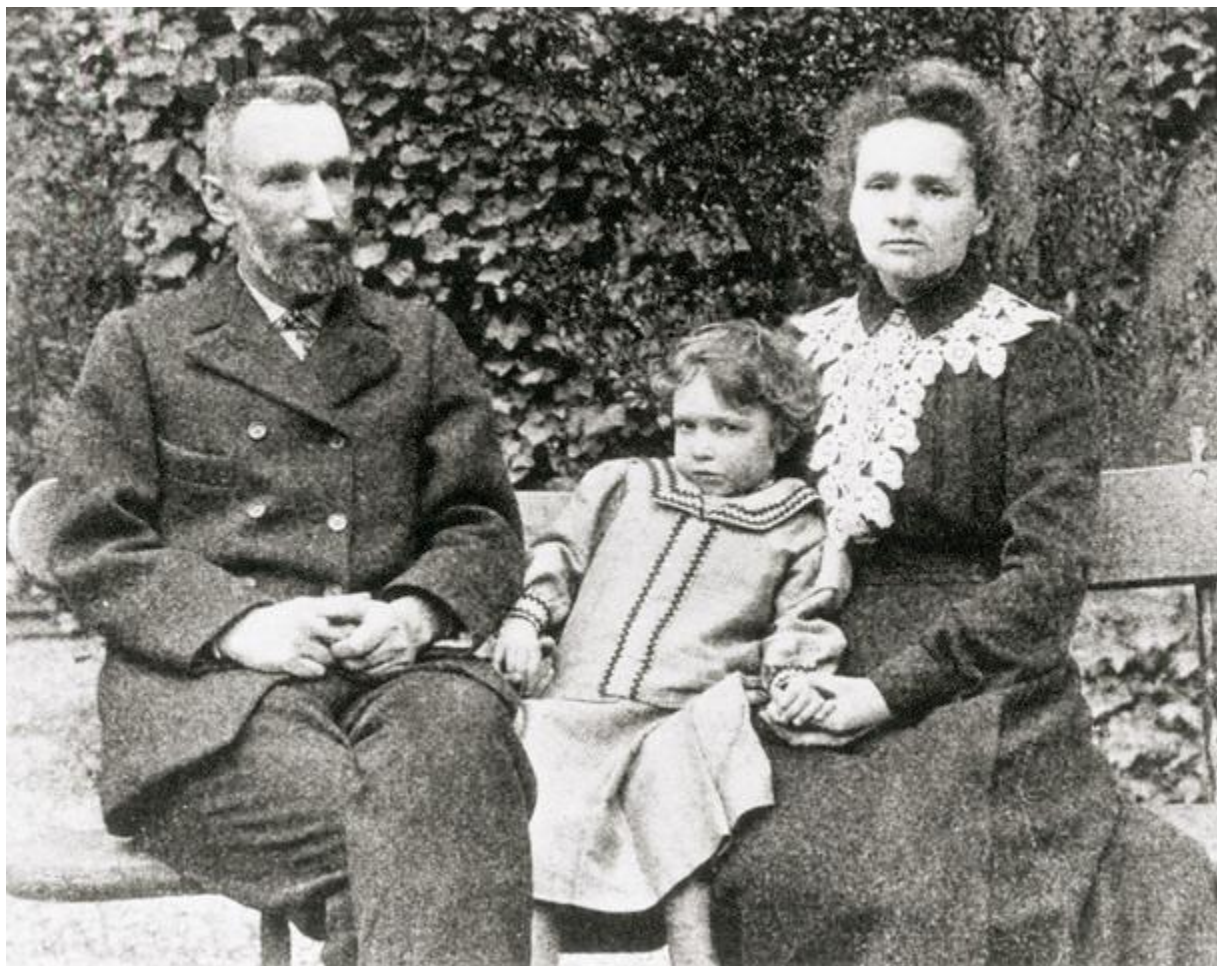
Troje noblistów na jednym zdjęciu: Piotr, Irene i Maria Curie