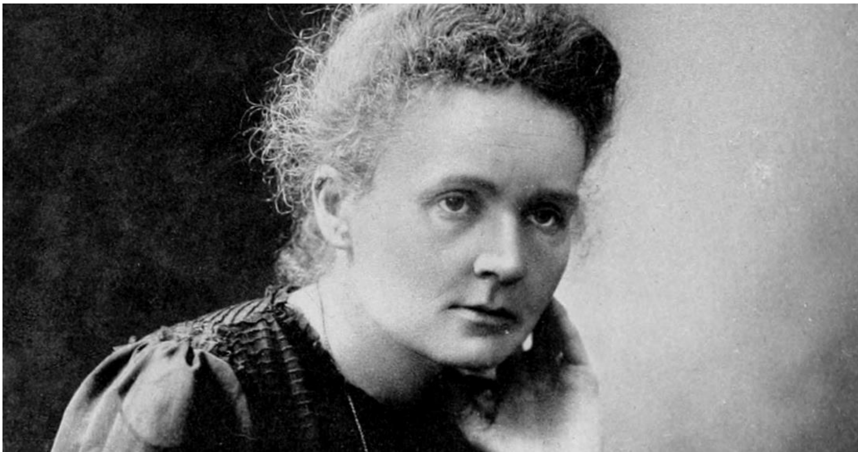
Maria Skłodowska-Curie w 1911 roku, zdjęcie zrobione z okazji przyznania jej drugiej nagrody Nobla.