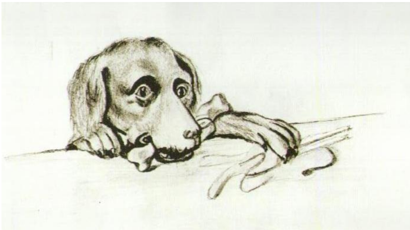
Ukochanym psem rodziny Skłodowskich był wyżeł Lancet. Rysunek kilkunastoletniej Marii.