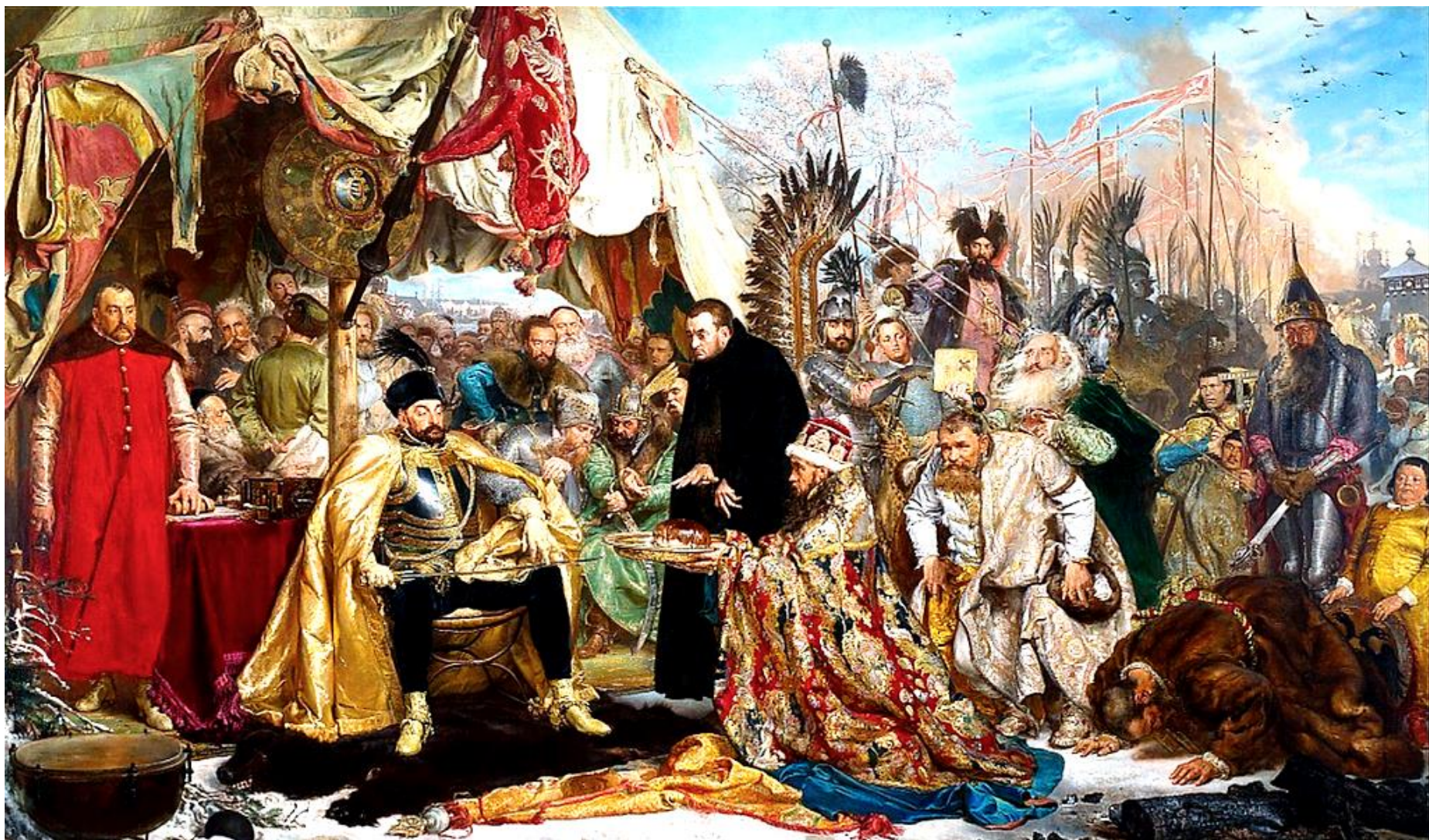
Stefan Batory pod Pskowem, Jan Matejko