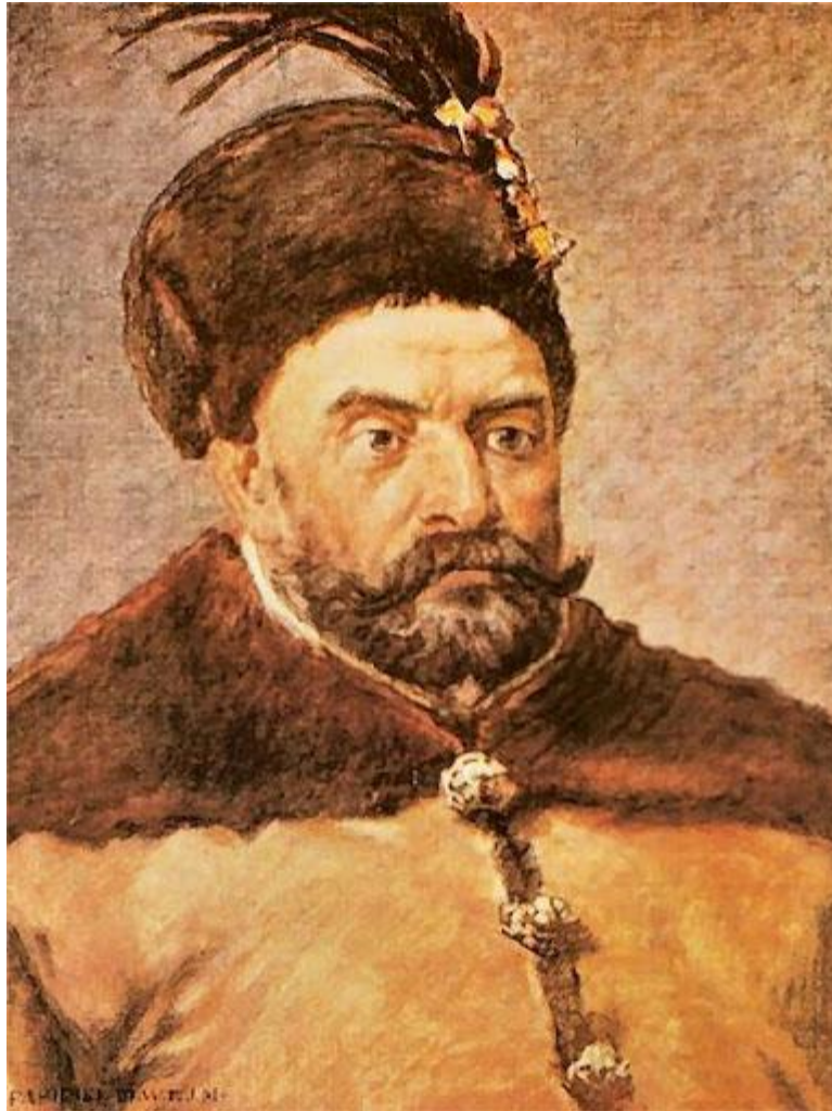
Stefan Batory, Jan Matejko