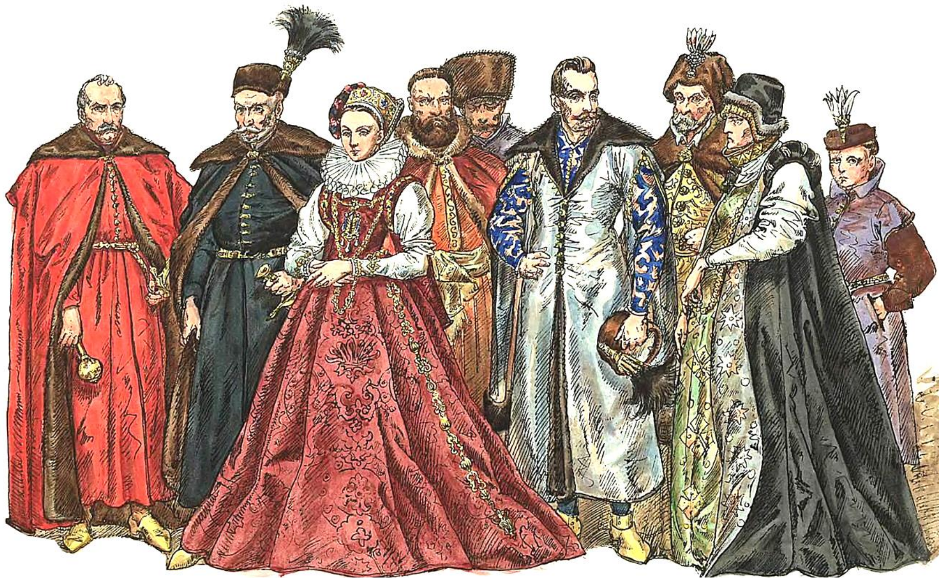
Polscy magnaci z czasów Stefana Batorego. Pierwszy z lewej stoi Jan Zamojski. Malował Jan Matejko.