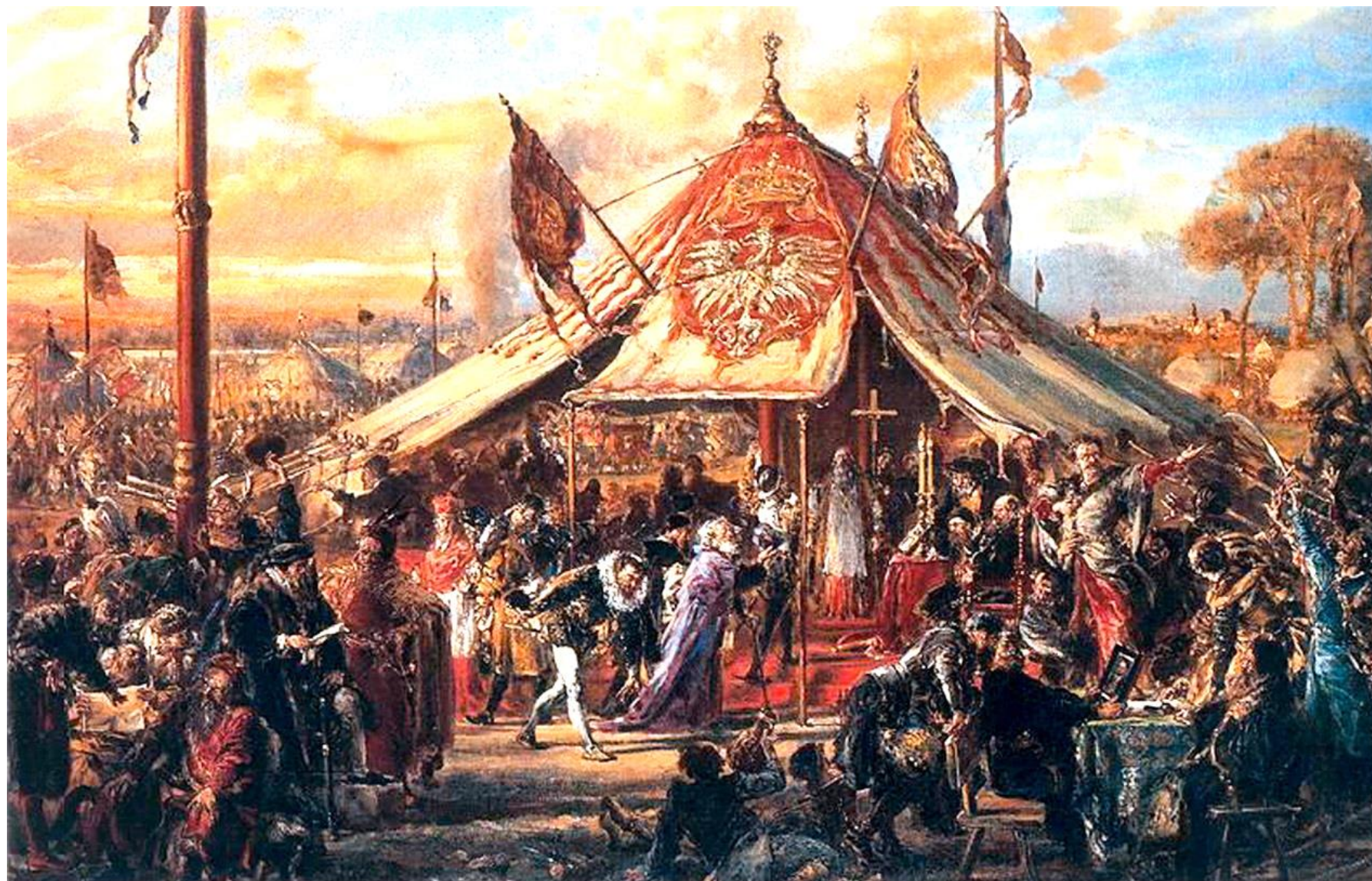
Wolna elekcja na obrazie Jana Matejki. Na pierwszym planie widać szopę, czyli wielki namiot dla dostojników.