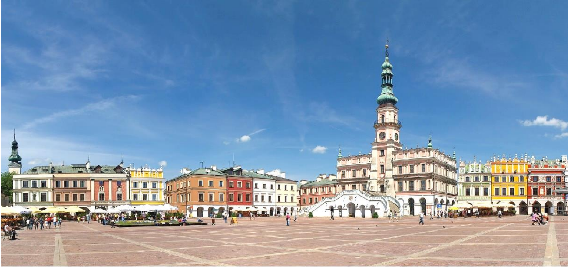
Rynek, o wymiarach 100 x 100 metrów, uchodził za jeden z najpiękniejszych placów Europy. Budynek z wieżą to Ratusz.